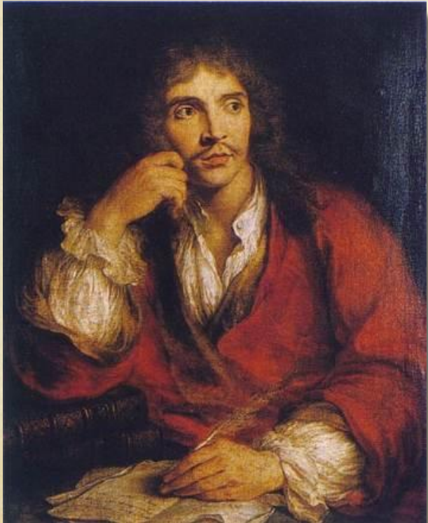
Жан-Батист Мольер (1622–1673 гг.)

Главная сюжетная линия, на которой построена пьеса Мольера «Мещанин во дворянстве», отражает определённый исторический этап развития класса буржуазии во Франции.