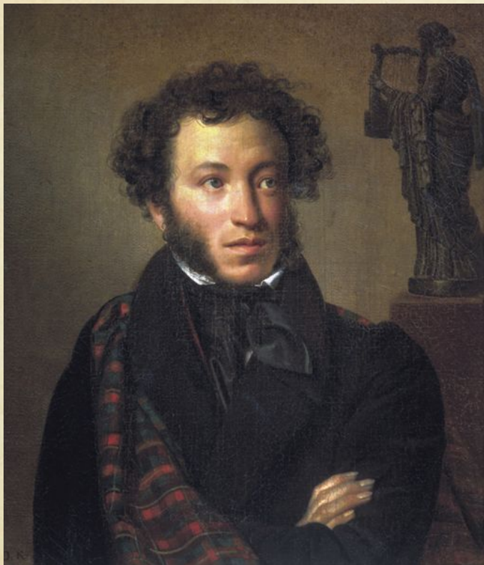
Александр Сергеевич Пушкин (1799–1837 гг.)