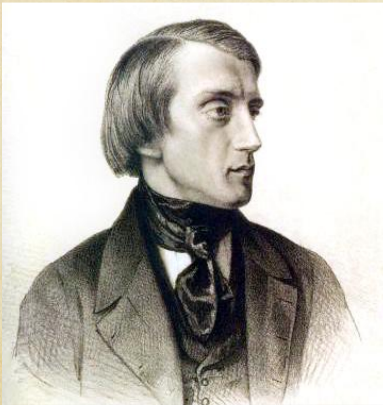
Виссарион Белинский (1811–1848 гг.)