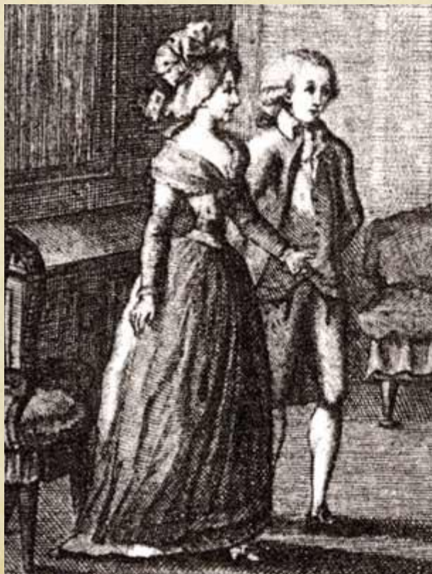
Люсиль и Клеонт