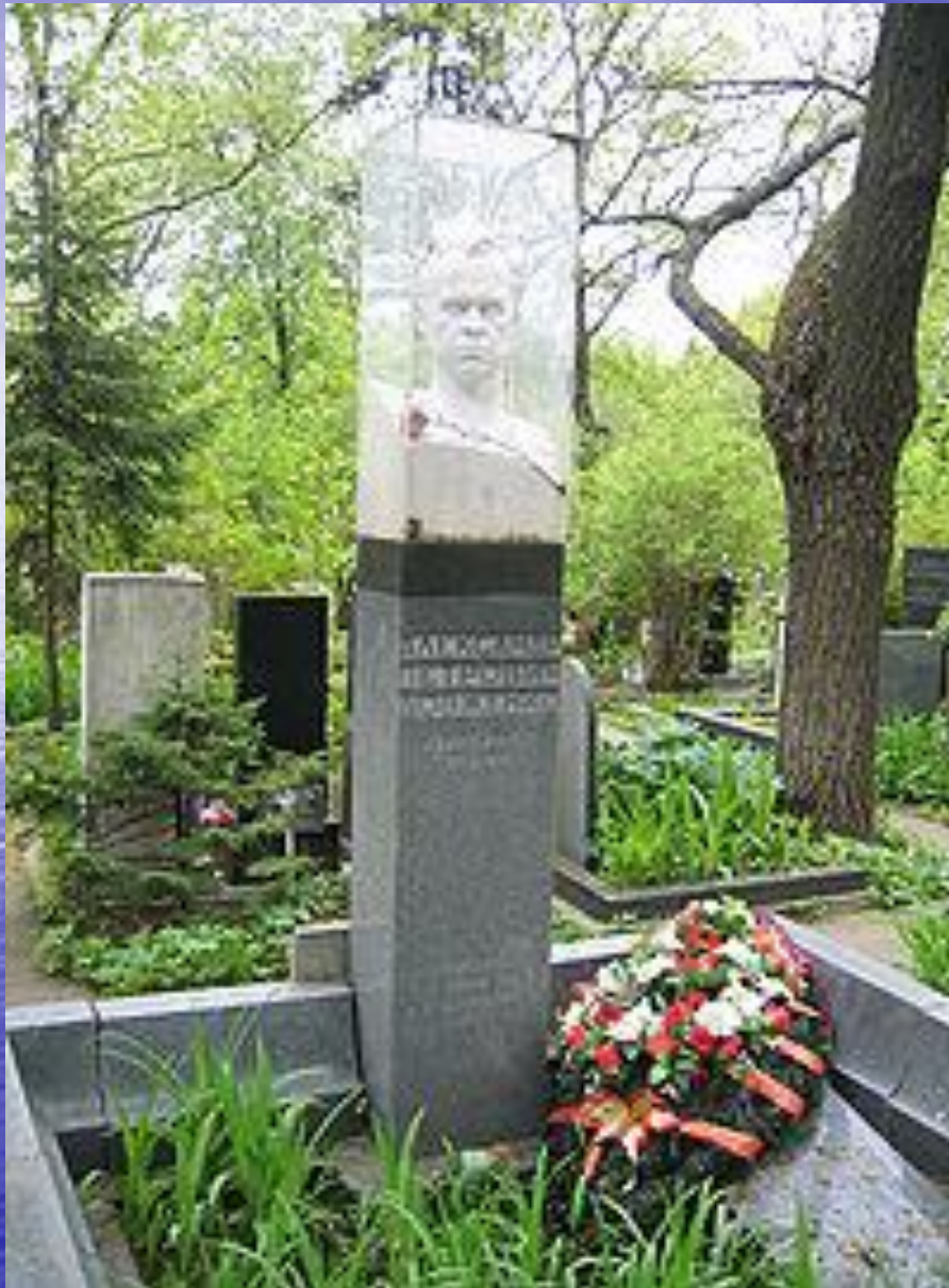
Могила О.П. Довженка у Москві. Новодівичий цвинтар