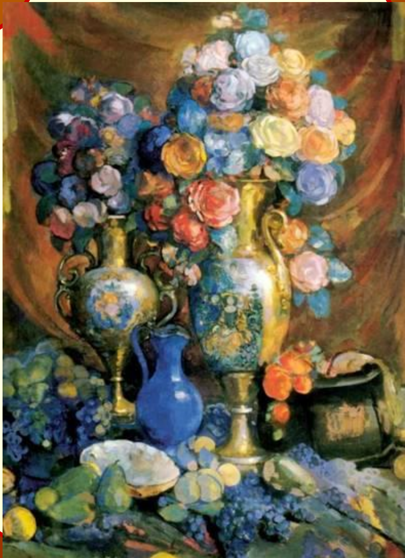
Н. Сапунов «Вазы, цветы и фрукты»