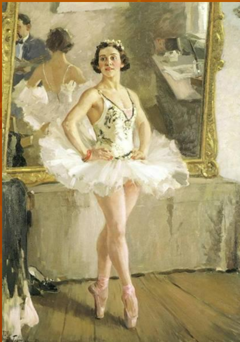
А. Герасимов «Портрет балерины О.В. Лепешинской»