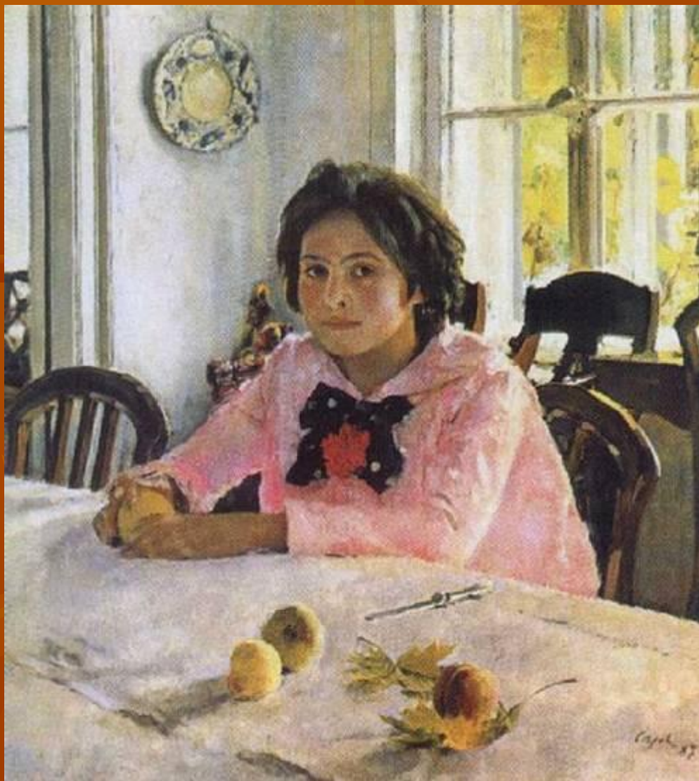
В. Серов «Девочка с персиками»