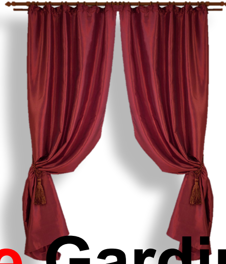
die Gardine (n)