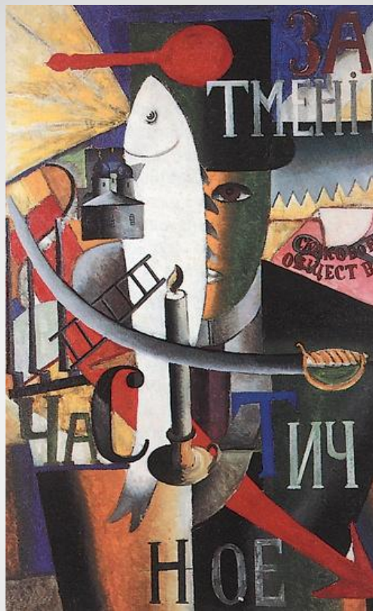
«Англичанин в Москве» К.С. Малевич, 1914 г.