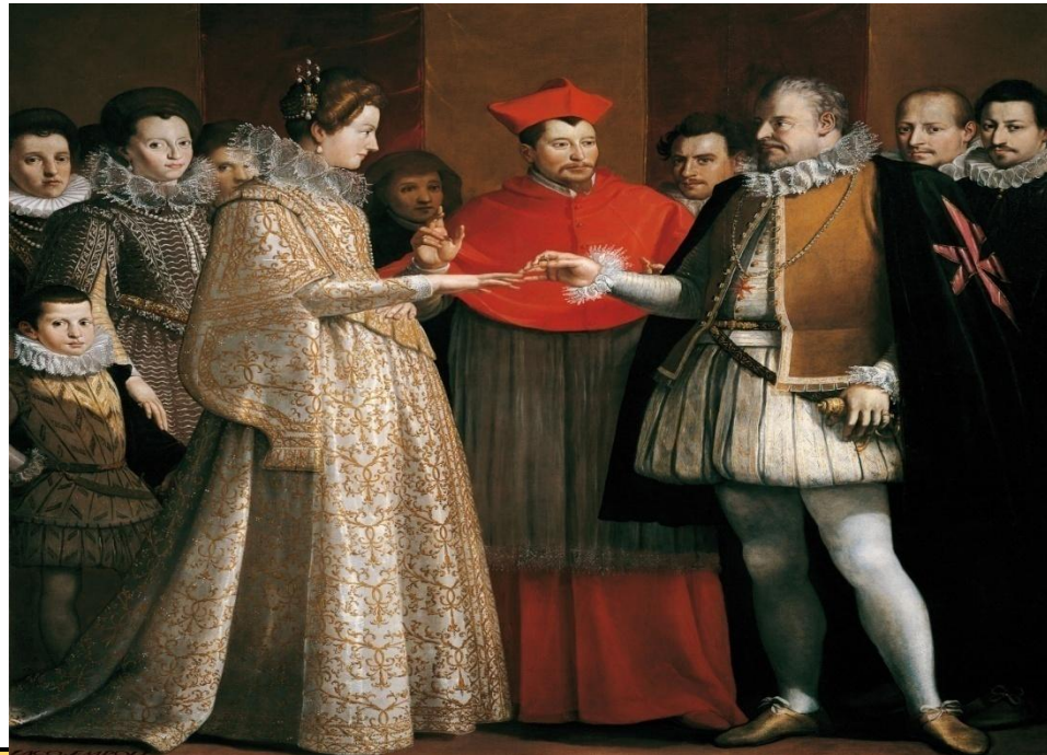
Свадьба Маргариты Валуа и Генриха Бурбона

Чтобы примирить католиков и гугенотов Карл IX решил выдать замуж свою сестру Маргариту за вождя протестантов короля Наваррского Генриха Бурбона. Свадьбу назначили на август 1572 года. Около 20 тыс. гугенотов съехались в Париж. Этим решили воспользоваться вожди католиков во главе с Екатериной Медичи, уничтожив протестантов во главе с адмиралом Колиньи.