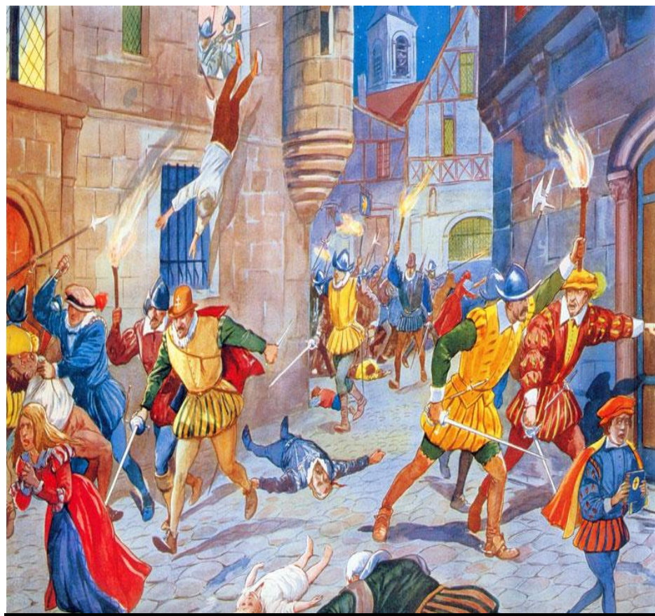
Резня во имя веры .

В этой борьбе гугеноты получали помощь от Англии и протестантских князей Германии, а католики — от Испании.