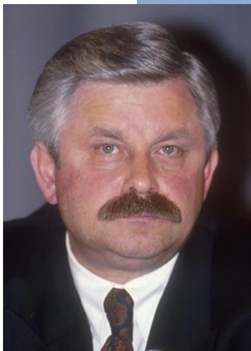
Ген. А. Руцкой, вице-президент РФ