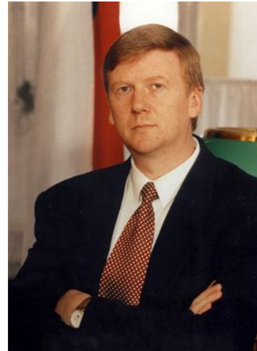
А.Б. Чубайс, зам. Пред. Правительства РФ