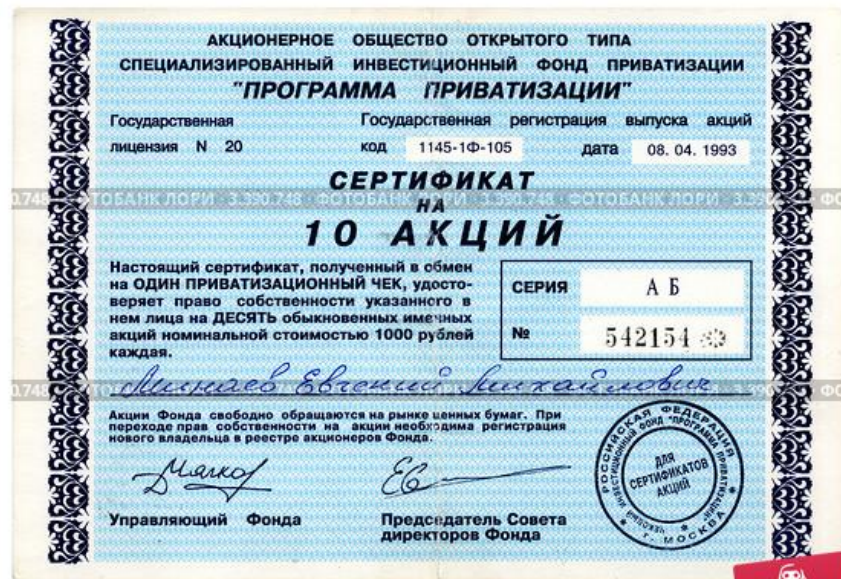
Акция чекового инвестиционного фонда Программа приватизации