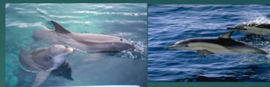
Афалина и белобочка