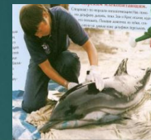
Защита вымирающих видов китообразных