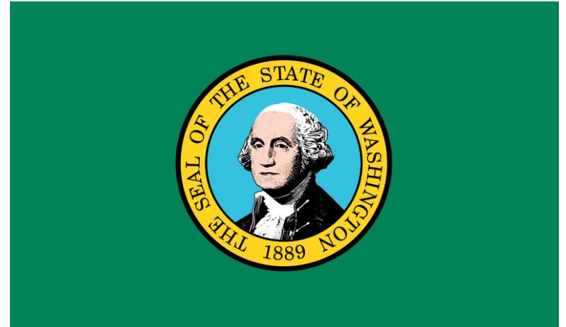
Флаг штата Вашингтон