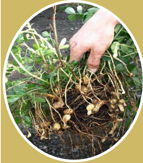
Виробництво риса, арахісу, бавовнику