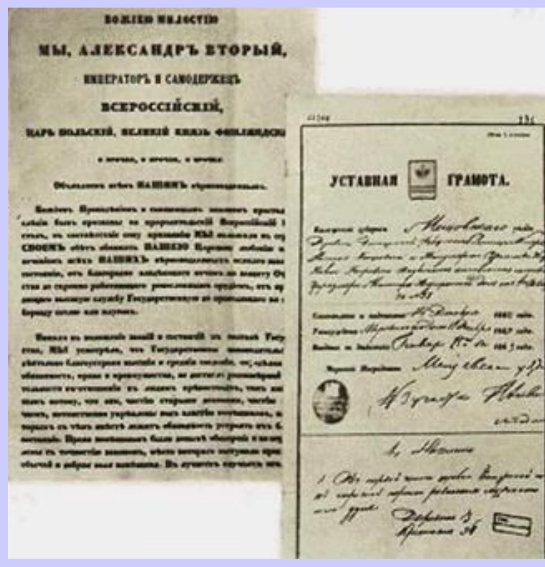
Документы «Великой реформы».

В декабре 1860 г. Проект был рассмотрен в Госсовете и 19 февраля 1861 г. Александр II подписал «Манифест» и «Положения».