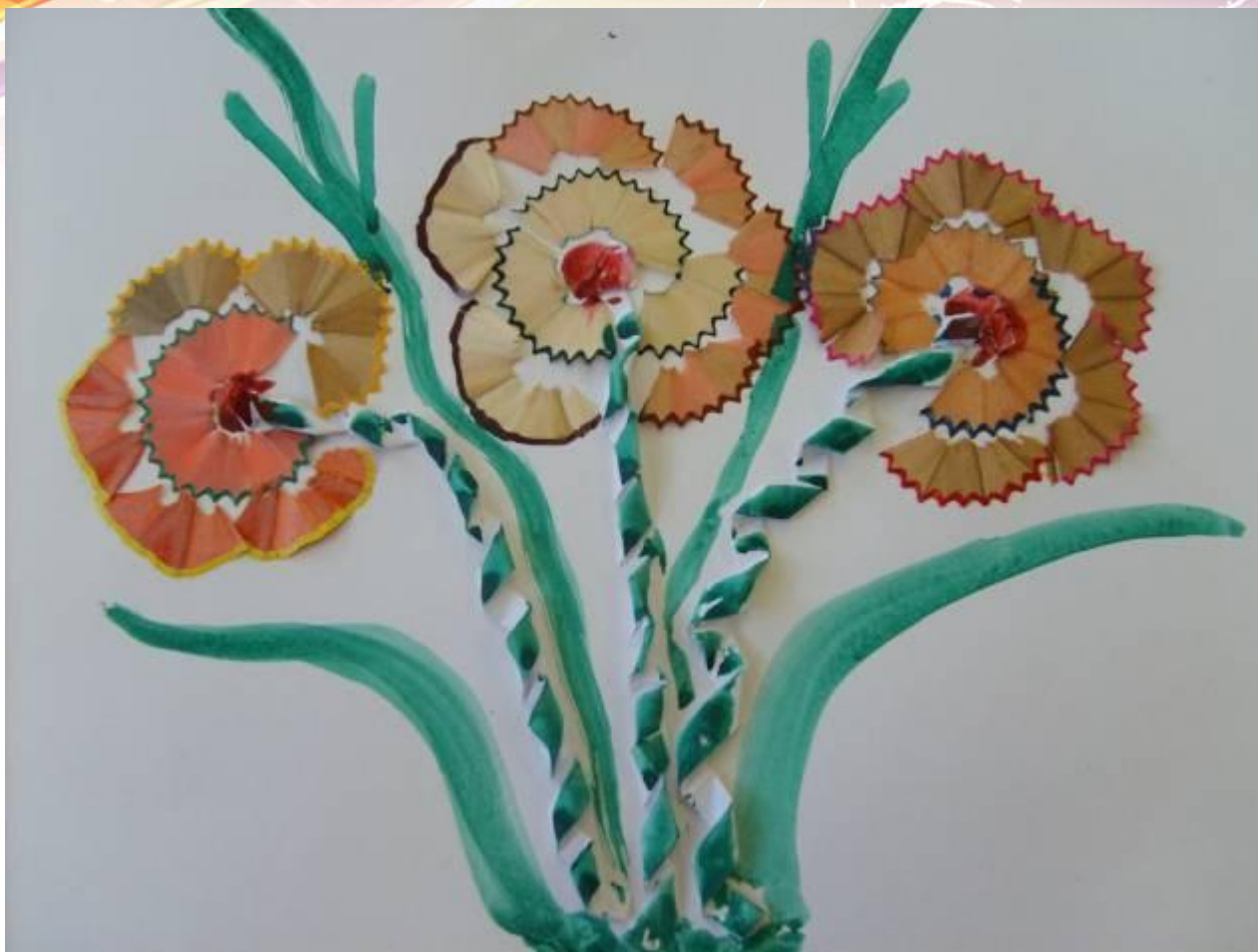
Мозаика из карандашных стружек