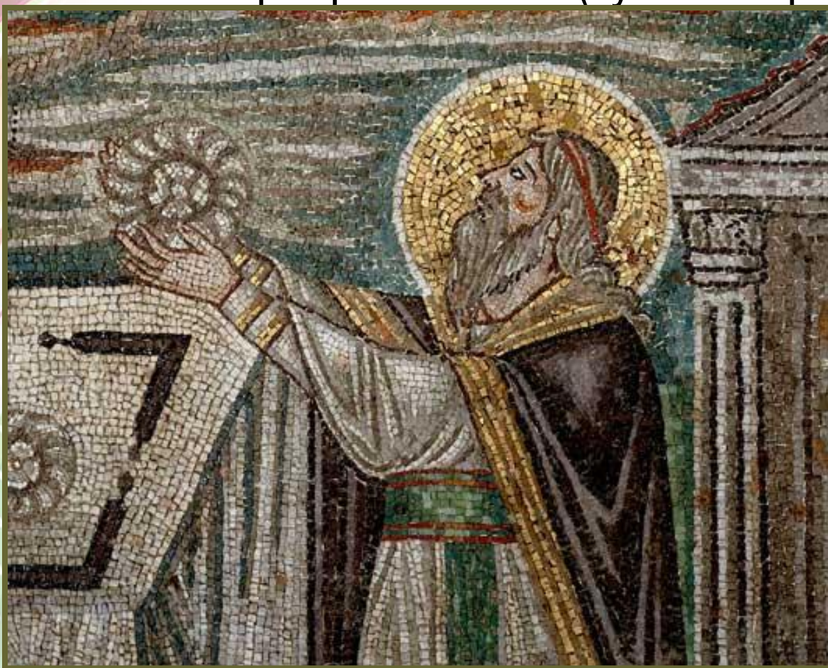
Деталь мозаики церкви Сан Витале в Равенне (Италия).

В 16 в. в Италии, которая была богата месторождениями мрамора, возник новый вид мозаики – флорентийская (кусочки мрамора с