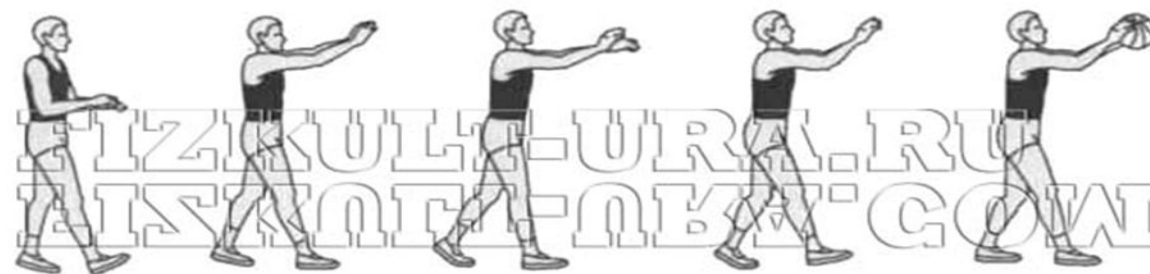
Ловля мяча двумя руками