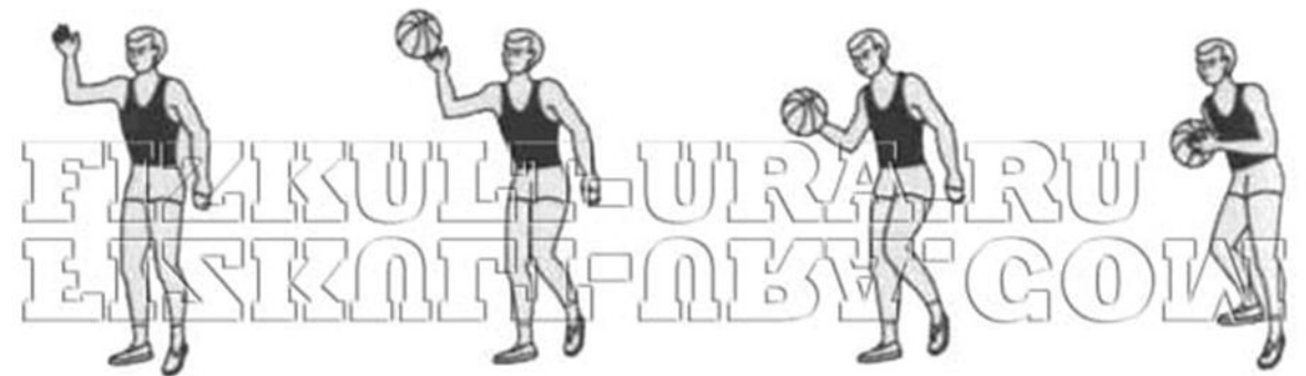
Ловля мяча одной рукой