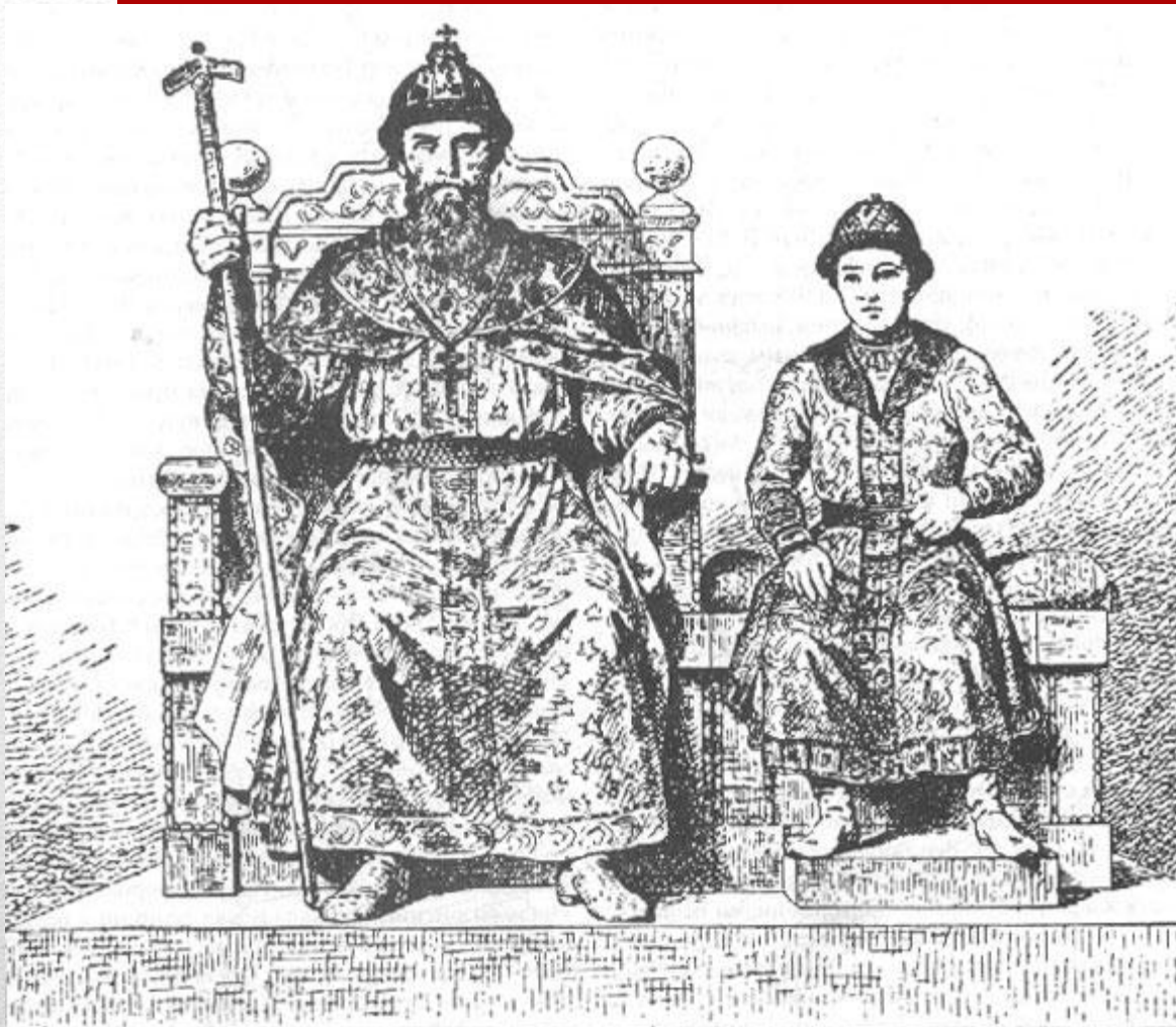
«Василий II Темный и его сын Иван» Неизвестный автор

Василий II понимал все опасности конкурентной борьбы за власть в Московском княжестве.