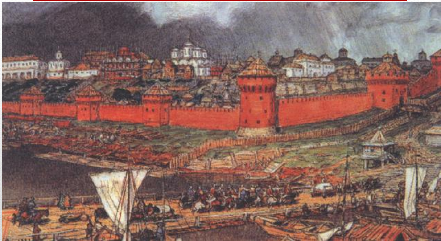
Васнецов А.М. «Московский Кремль при Иване III»