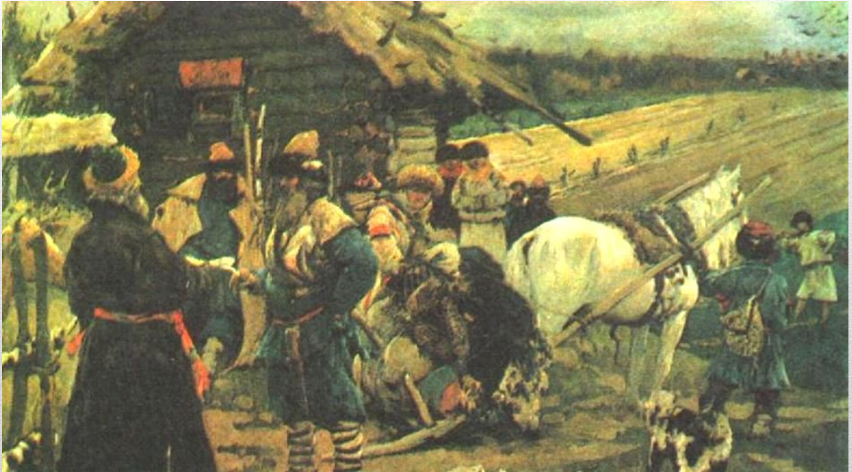
С. Иванов. Юрьев день

1497 г. – принят общий для всей страны Судебник