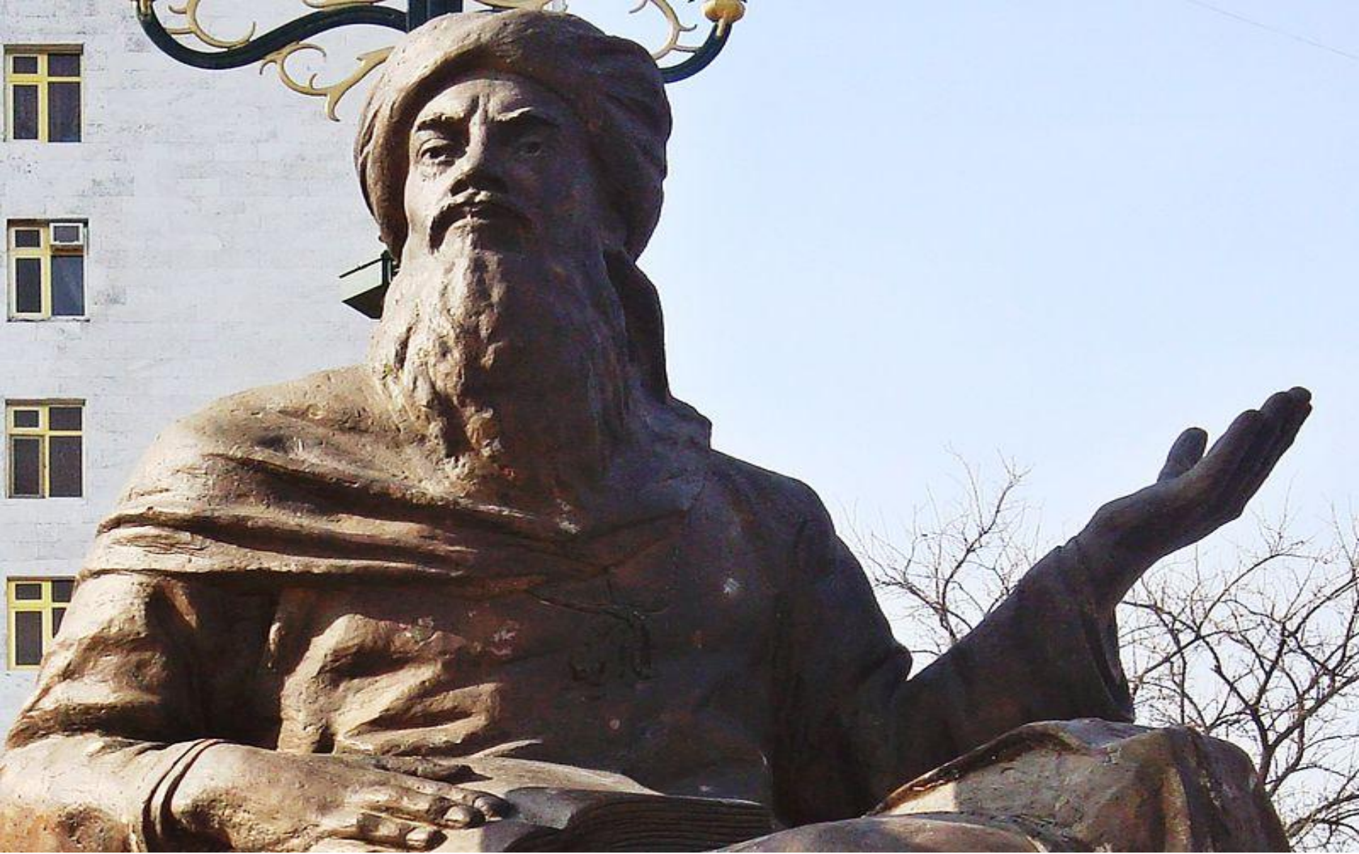
Памятник Ясави в Ашхабаде , ( Туркменистан )