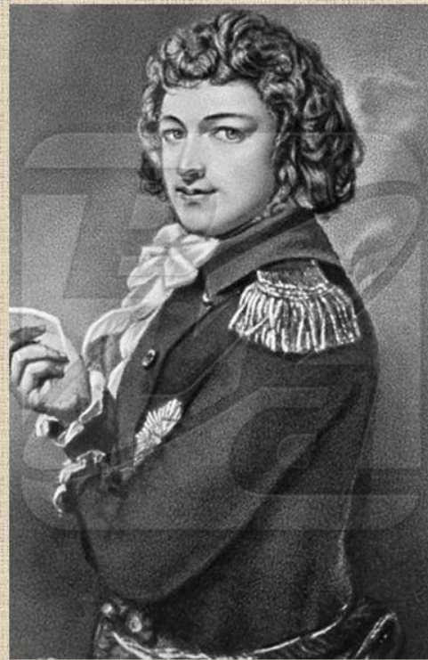
Михаил Клеофас Огинский