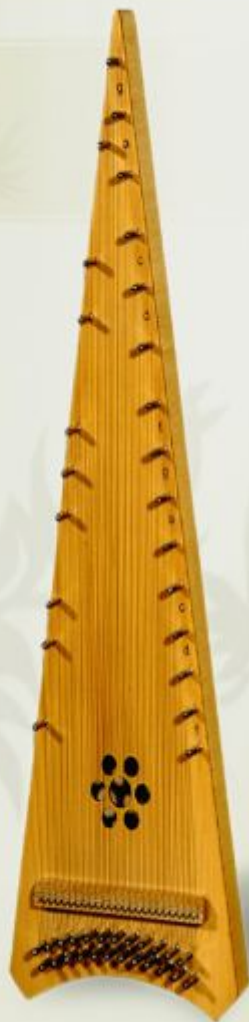
Псалтерий, альт Alto psaltery