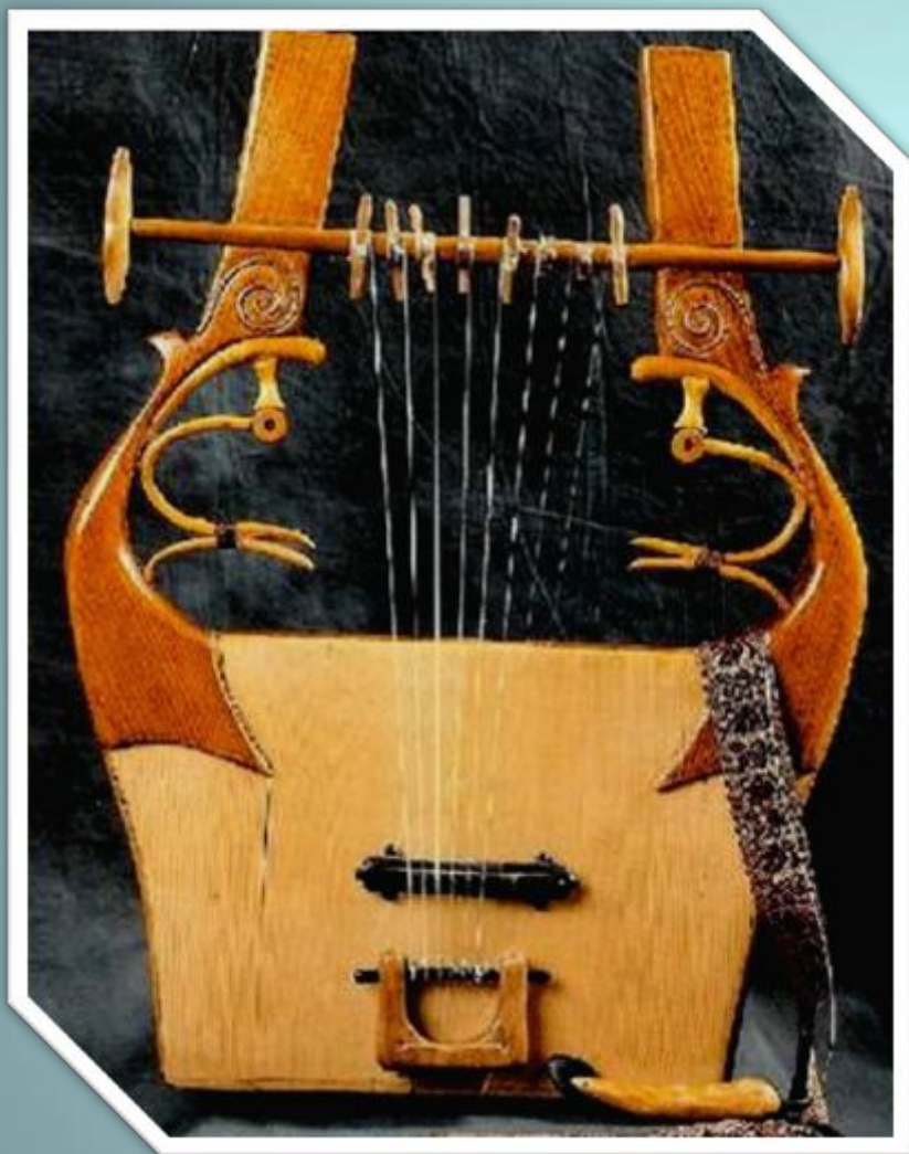
Кифара- древнегреческий струнный- щипковый инструмент