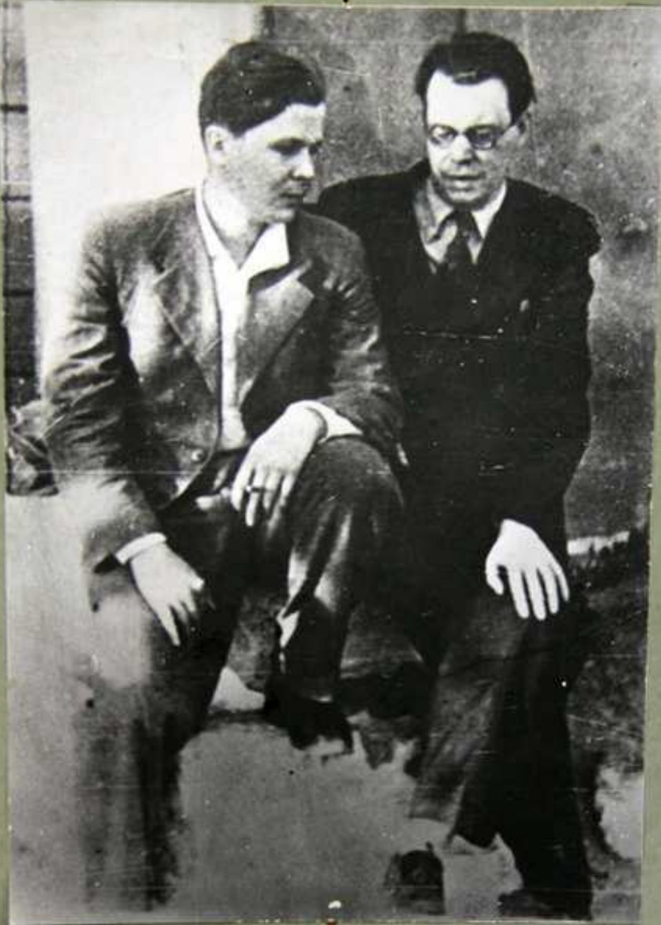
А. Твардовский и М. В. Исаковский. 30 е годы.