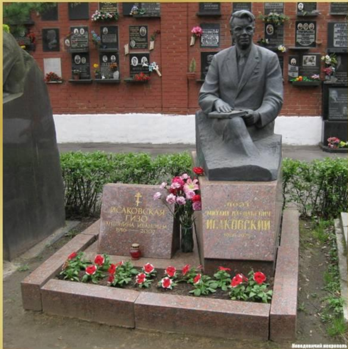
Памятник на могиле М.В.Исаковского