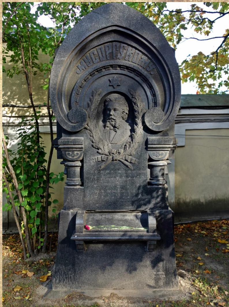
Могила М.П. Мусоргского в Некрополе Санкт-Петербурга

16 марта 1881 года после продолжительной тяжелой болезни скончался М.П. Мусоргский