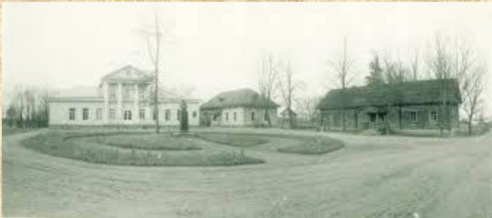
Усадьба Мусоргских в селе Кареве (Псковская область). Родовое имение Чириковых Панорама (XIX век)

М.П. Мусоргский родился 9 марта 1839 года в селе Кареве Псковской области.