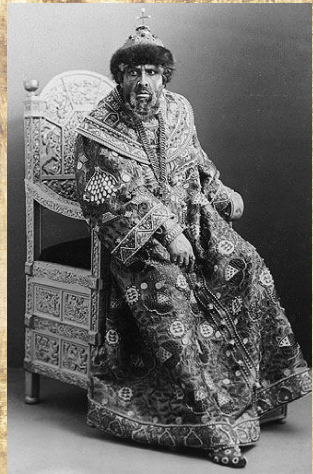
Федор Иванович Шаляпин в costume царя Бориса Годунова