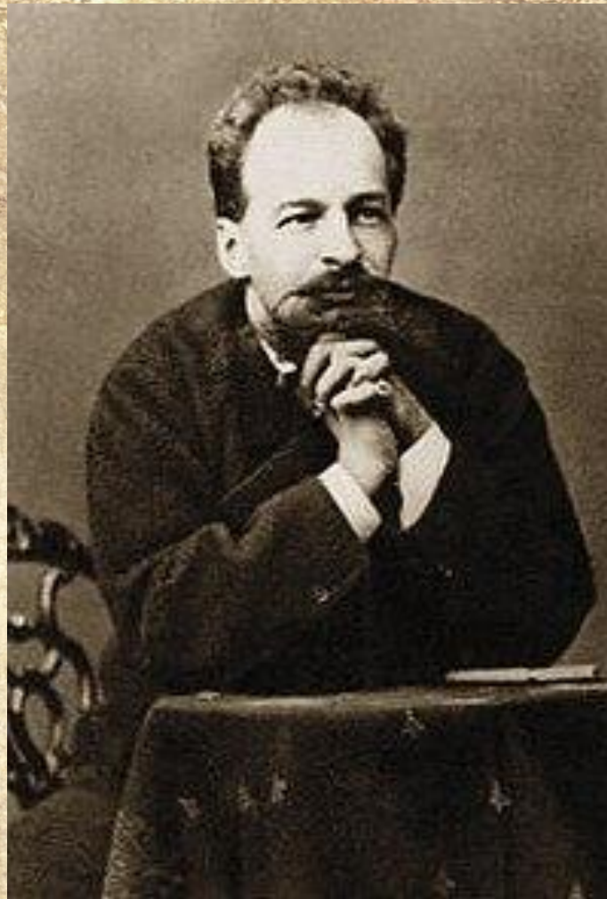
Виктор Александрович Гартман (1834-1873)

русский архитектор, орнаментист и художник