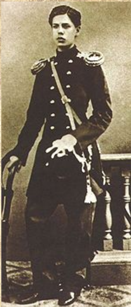
Юный Модест Петрович в форме гвардейского офицера