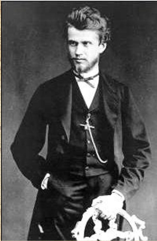
Эдуард Францевич Направник (1839-1916) русский композитор, дирижер