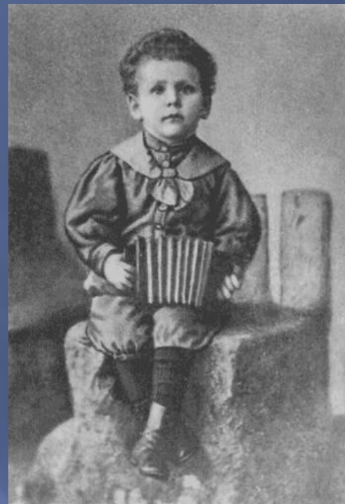
Е. Л. Шварц. 1899. Екатеринодар.

СОВЕТСКИЙ ПИСАТЕЛЬ Ленинградское отделение - 1962