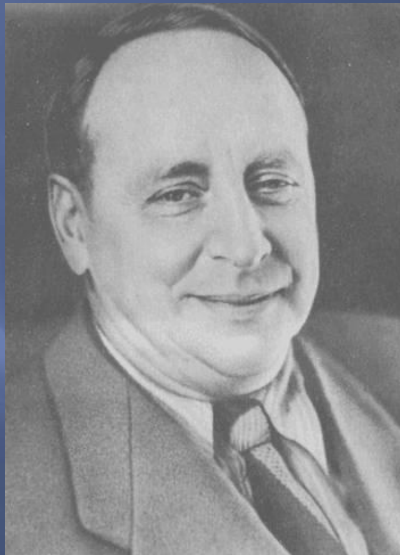
Е. Л. Шварц. Последняя фотография. 1957 г. Ленинград.

За четыре года до смерти Евгений Львович Шварц в своем дневнике написал о себе самом в третьем лице: "Без людей он жить не может... Всегда преувеличивая размеры собеседника и преуменьшая свои, он смотрит на человека как бы сквозь увеличительное стекло... И в этом взгляде... нашел Шварц точку опоры. Он помог ему смотреть на людей как на явление, как на созданий божьих".