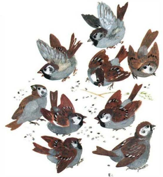
Е. Чарушин. Воробьи.