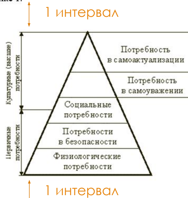
Рисунок 1 – Пирамида потребностей по А. Маслоу

Теория А. Маслоу . Одна из наиболее известных теорий содержания мотивации – основана на результатах многочисленных психологических исследований. Потребности рассматриваются как осознанное отсутствие чего-либо, вызывающее побуждение к действию. Совокупность потребностей приставлена на рисунке 1.