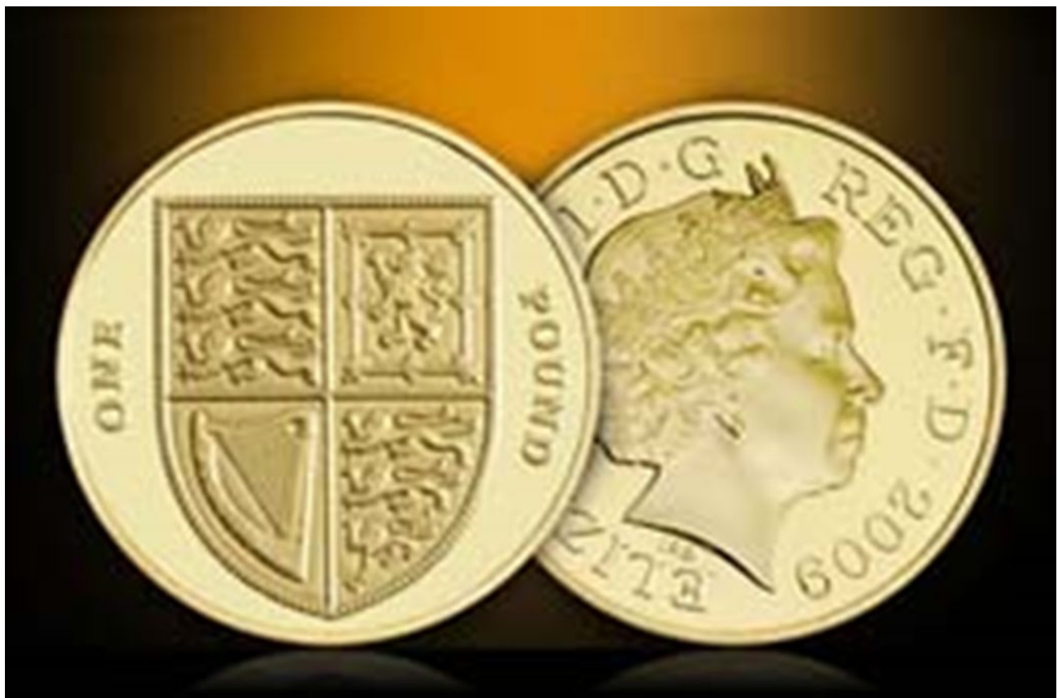
Монета 1 фунт стерлингов