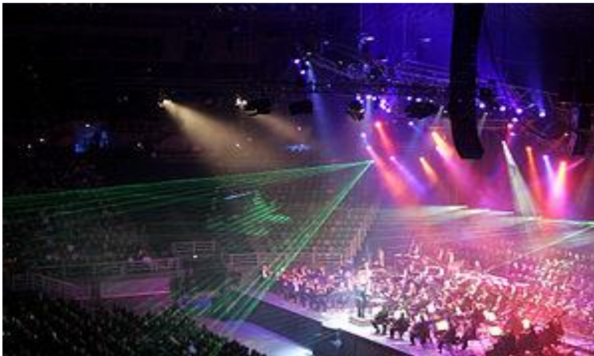
Концерт классической музыки в центре Rod Laver Arena в Мельбурне ( Австралия ), 2005 год

Концерт — произведение для одного или (реже) нескольких солирующих инструментов и оркестра, а также публичное исполнение музыкальных произведений.