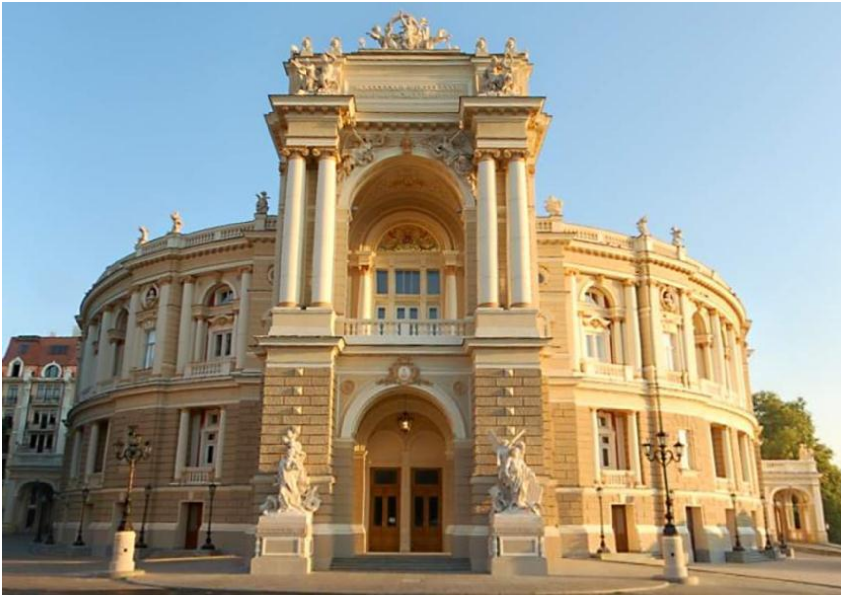
Одесский оперный театр