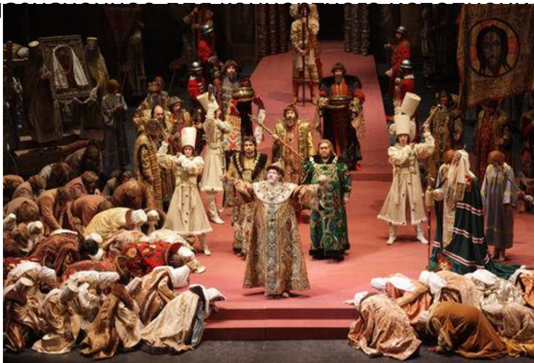
Опера «Борис Годунов»

Оратория — произведение для солистов, хора и оркестра, предназначенное для исполнения в концертном зале.