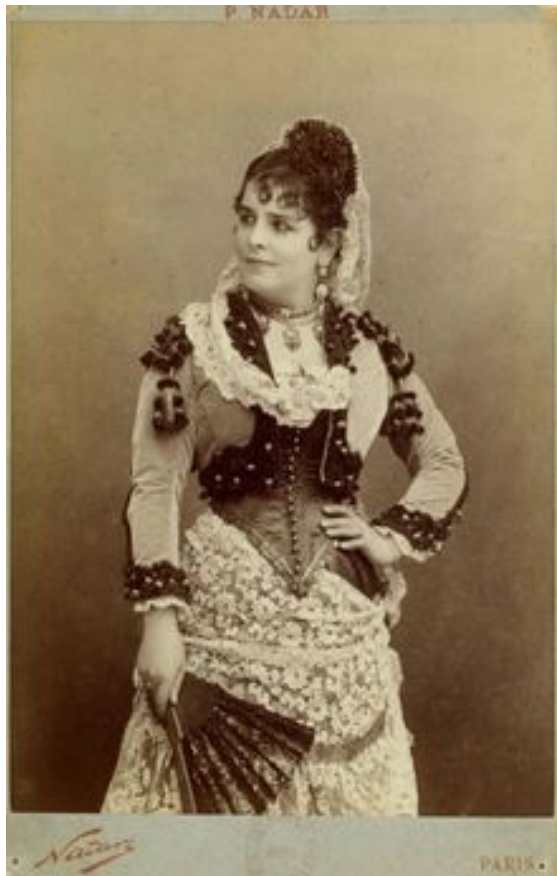
Галли-Марье — первая исполнительница партии Кармен. (1875)

Ария — законченный по построению эпизод в опере, оперетте, оратории или кантате, исполняемый певцом-солистом в сопровождении оркестра.