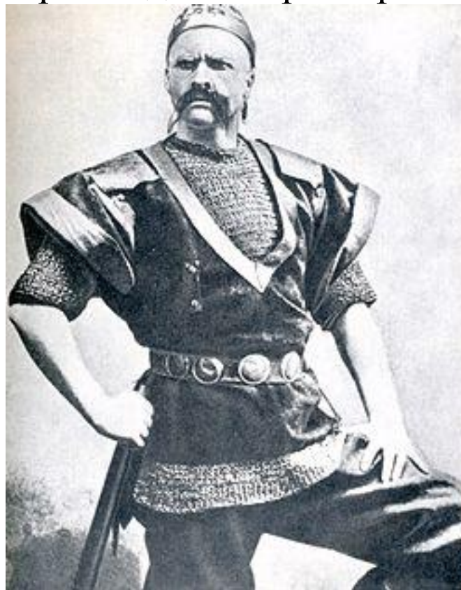
Фёдор Шаляпин в роли варяжского гостя, 1897 год Опера «Садко» Н. Римский-Корсаков