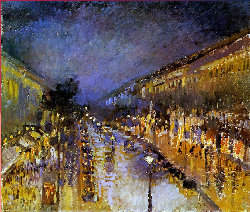
Бульвар Монмартр ночью, 1897

будучи одновременно учеником и учителем, мастер перенимал опыт предшественников и передавал полученные навыки потомкам. Став творческим «отцом» Жоржа Сера, Поля Сезанна, Винсента Ван Гога и Поля Гогена, пейзажист проповедовал новое искусство.