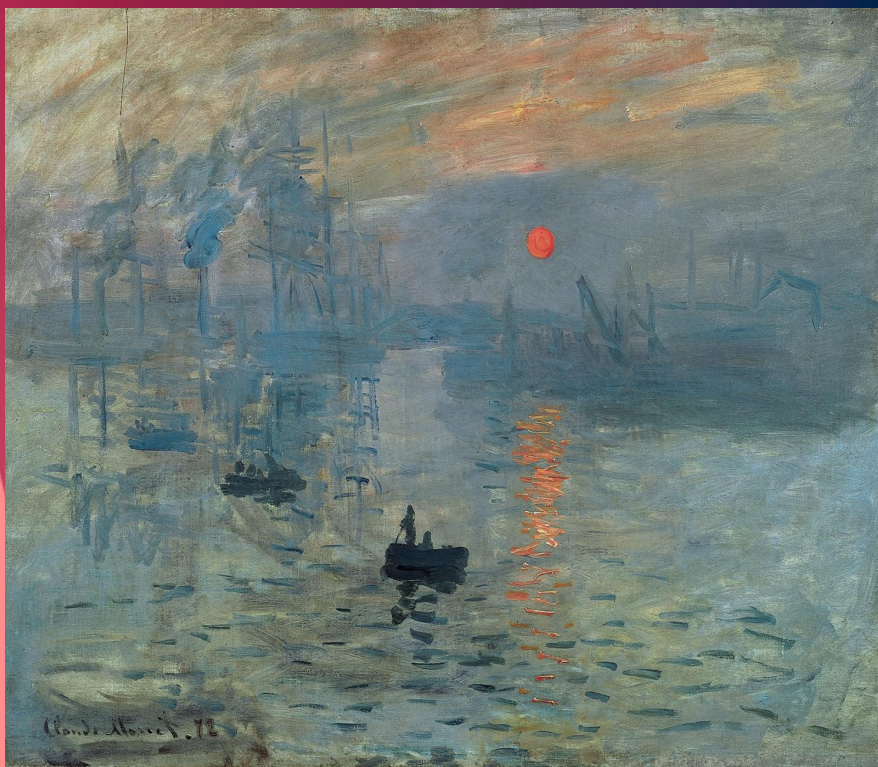
Impression, Sunrise, 1873

один из виднейших представителей импрессионизма, сооснователь и теоретик данного направления. Живописная манера Моне, ставшая впоследствии классической для импрессионизма, характеризовалась письмом отдельными мазками чистого цвета, позволяющим создавать богатые световые эффекты и передавать особенности свето-воздушной среды.