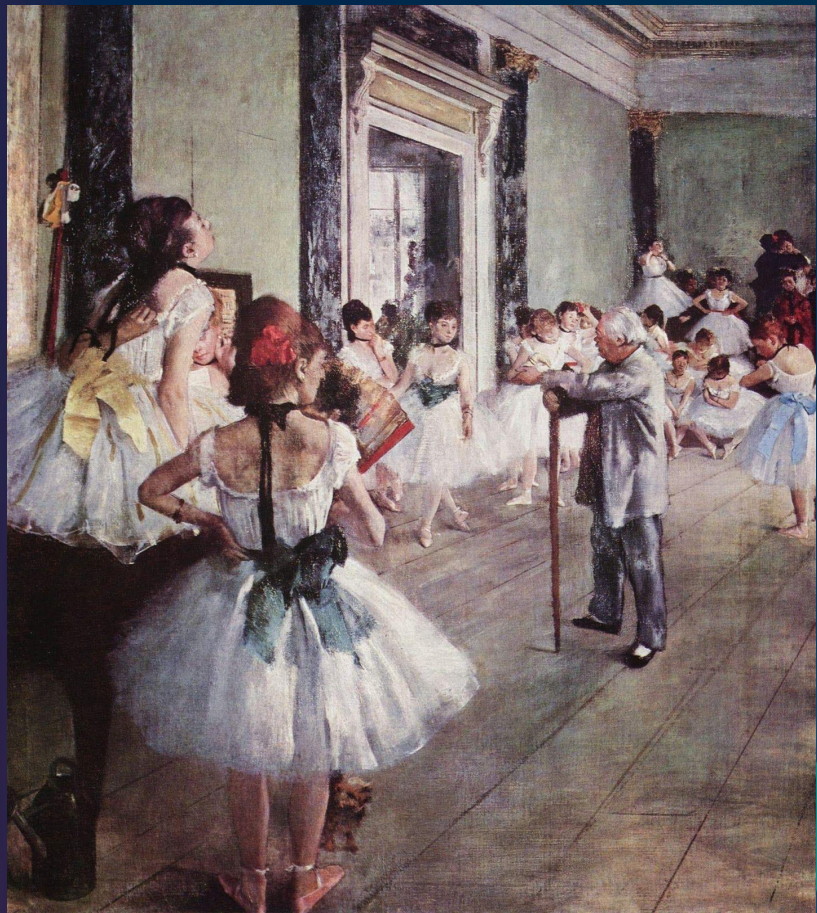
Танцевальный класс, 1874