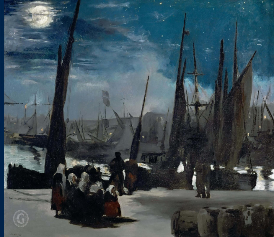
Лунная ночь в Булонском порту, 1869