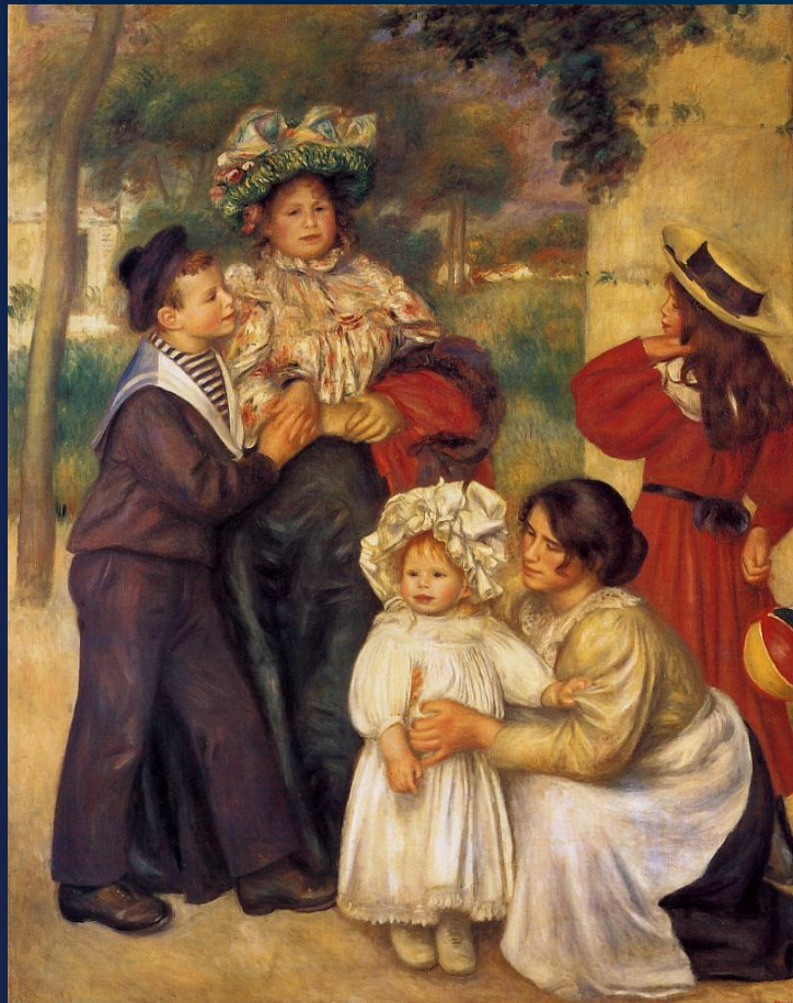
The Artists Family, 1896