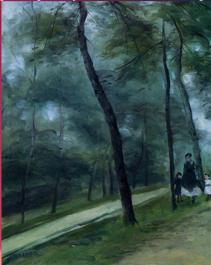
A Walk in the Woods, 1875

Однажды Огюст Ренуар сравнил себя с пробкой, которую несет по волнам. Именно так он ощущал себя во время создания очередного произведения. С манящей страстью и нежностью он полностью отдавался бушующим «волнам», которые несли его по незыблемым просторам художественного мира.