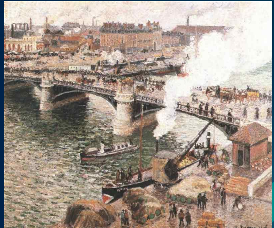
Мост Буаэльдьё, Руан. Дождливая погода, 1896