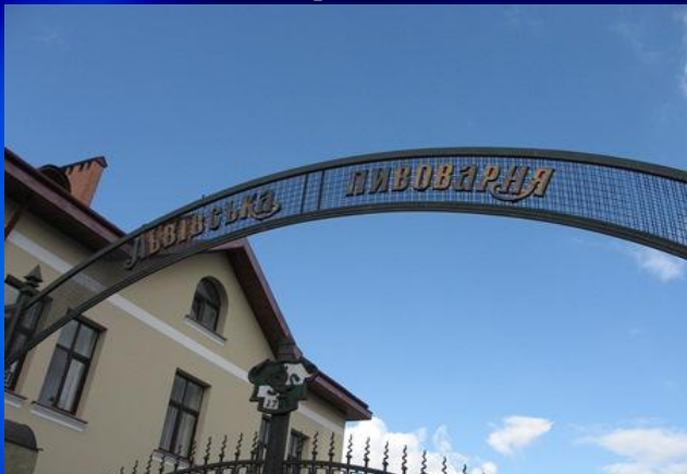
«Львівська пивоварня» м. Львів