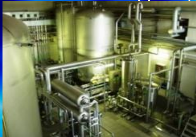
Пивзавод «САРМАТ» м. Донецьк