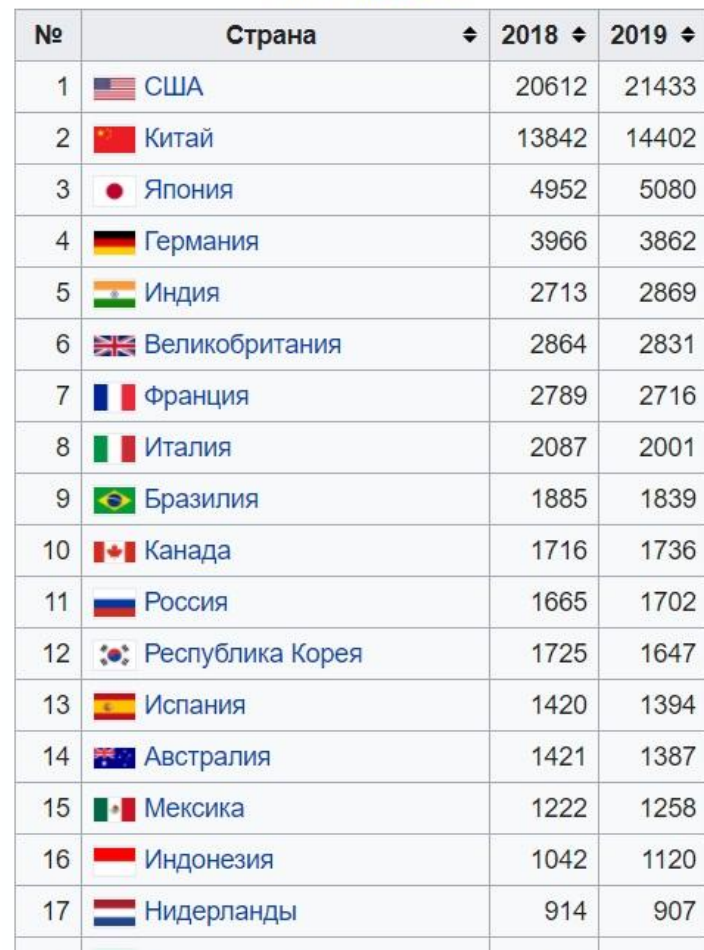
Список МВФ [1]