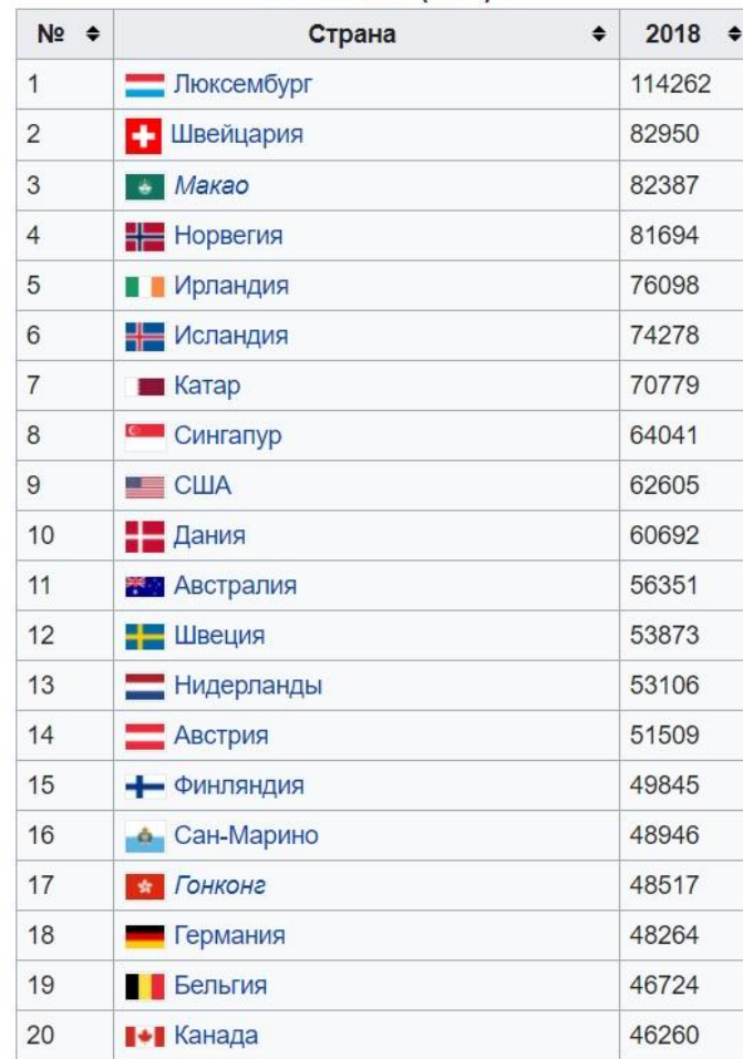
Список МВФ (2018) [1]

ВВП на душу населения в 2018 году, млрд. долл. США