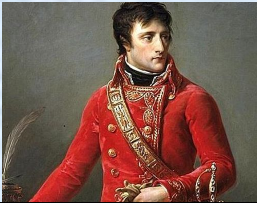
Наполеон Бонапарт, Первый консул Французской республики в 1799 – 1804 гг.

После заключения мира между Россией и Францией Наполеон Бонапарт поставил вопрос о военном союзе между двумя государствами, направленном против Англии.