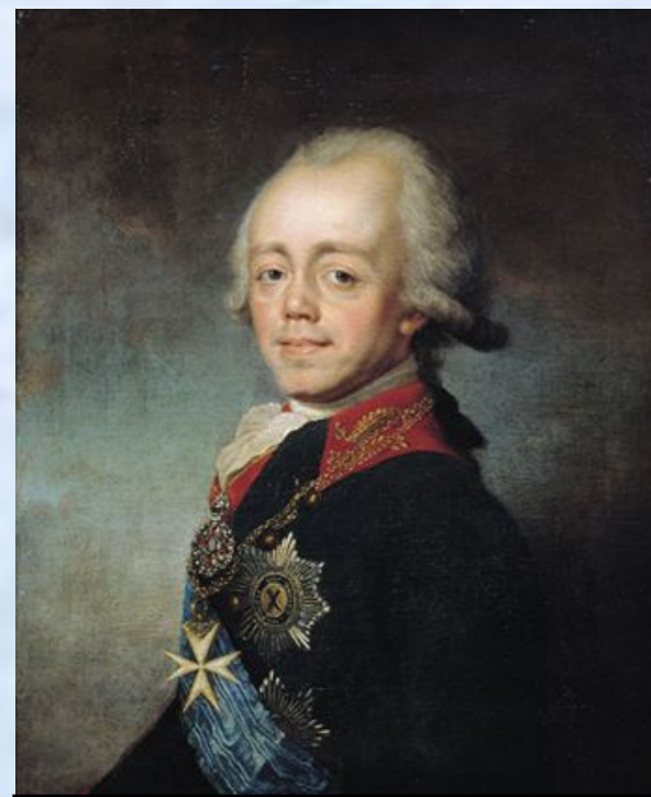
Император Павел I (1796 – 1801)