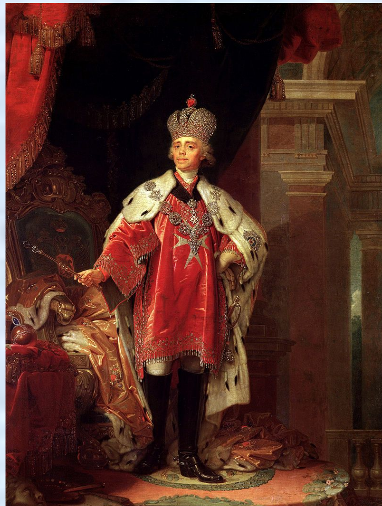
В. Л. Боровиковский. Павел I в costume Великого магистра Мальтийского ордена

Павел I стремился освободить Мальту от французов.