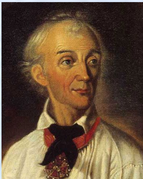
Генералиссимус А. В. Суворов

1799 г. – Итальянский и Швейцарский походы А. В. Суворова.