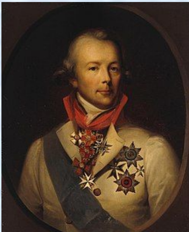
Граф П. А. Пален, глава заговора против Павла I

11 марта 1801 г. – заговор против императора Павла I. Убийство императора Павла I.