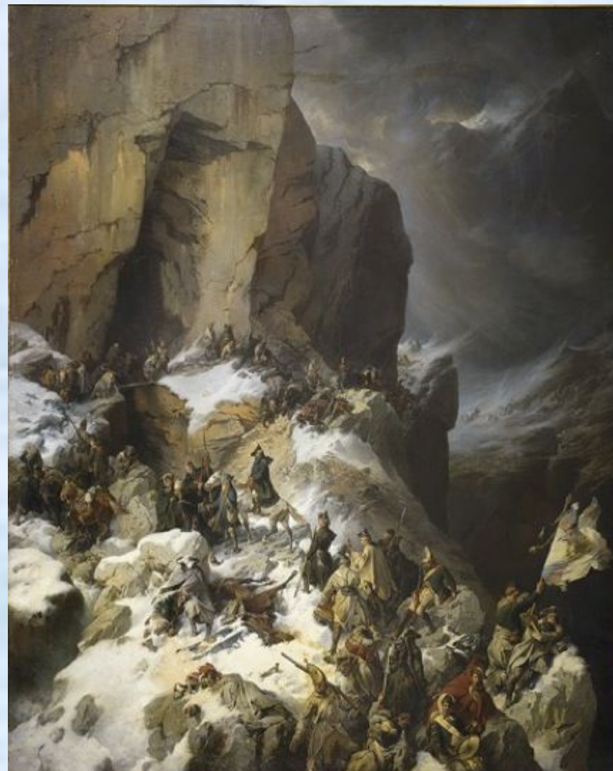
А. Е. Коцебу. Переход русских войск через Паникс в Альпах