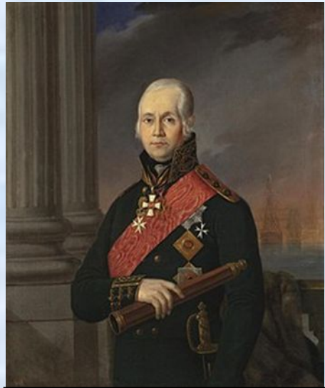
Адмирал Ф. Ф. Ушаков