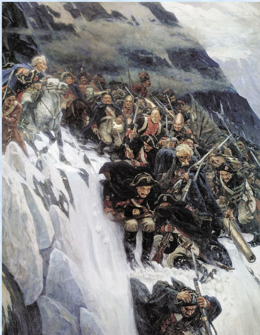
В. И. Суриков. Переход Суворова через Альпы