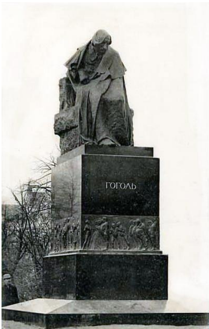
Памятник Н. В. Гоголю работы скульптора Н. А. Андреева (1909)