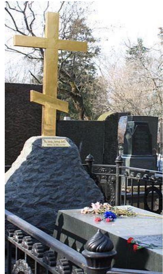
Восстановленный крест на могиле Н. В. Гоголя на Новодевичьем кладбище(2010 год)