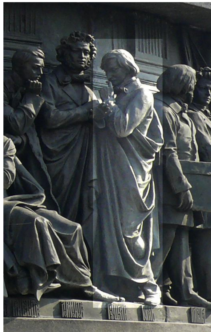
Н. В. Гоголь на Памятнике «1000-летие России» в Великом Новгороде