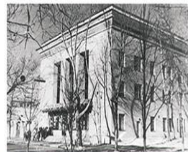
В 1963 году так выглядело здание воронежской филармонии в котором разместился ТЮЗ. После нескольких больших реставраций наш театр живет в нём по настоящее время.