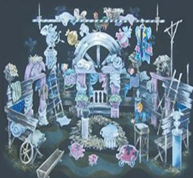
Эскиз к спектаклю «Недоросль» Д. Фонвизина