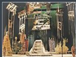
Оформление сцены в спектакле «Песнь о Бумбараше» Ю. Кима, В. Дашкевича по мотивам произведения А. Гайдара