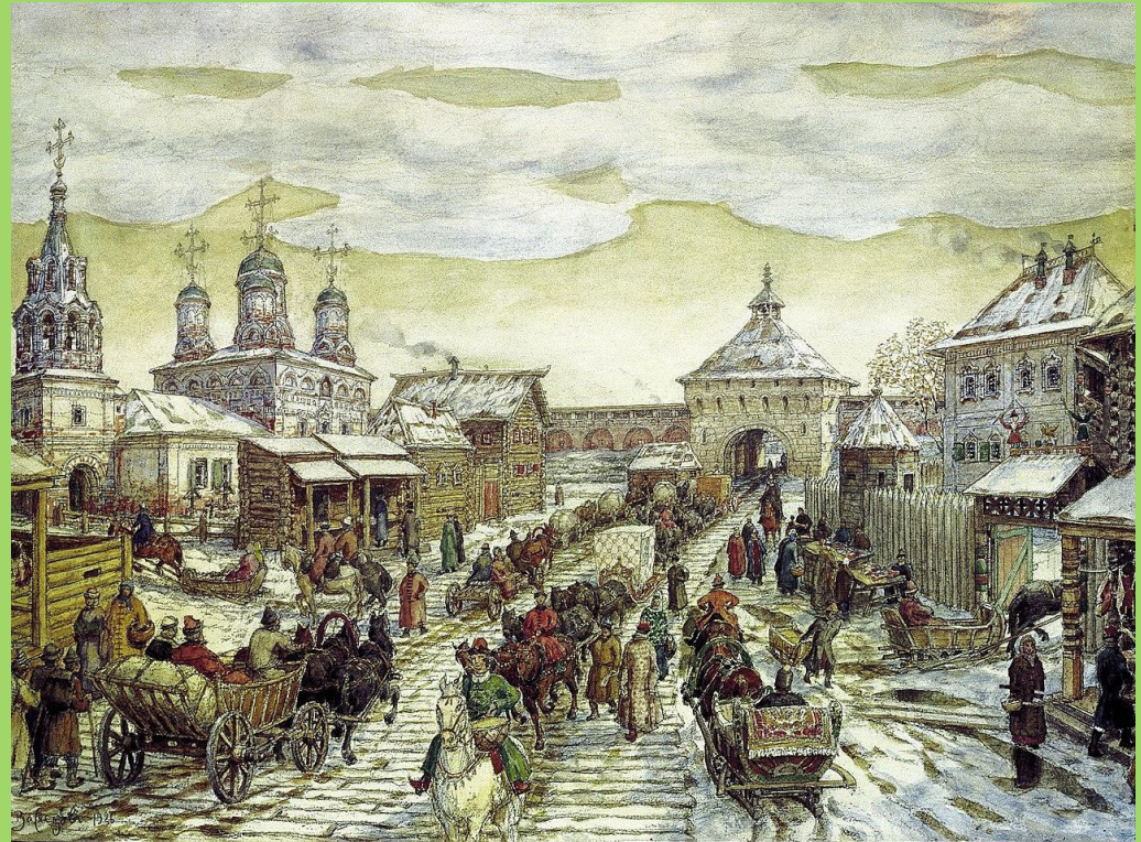
А.Васнецов «Мясницкие ворота Белого города»