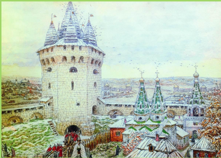
А.Васнецов «Семиверхая башня Белого города»