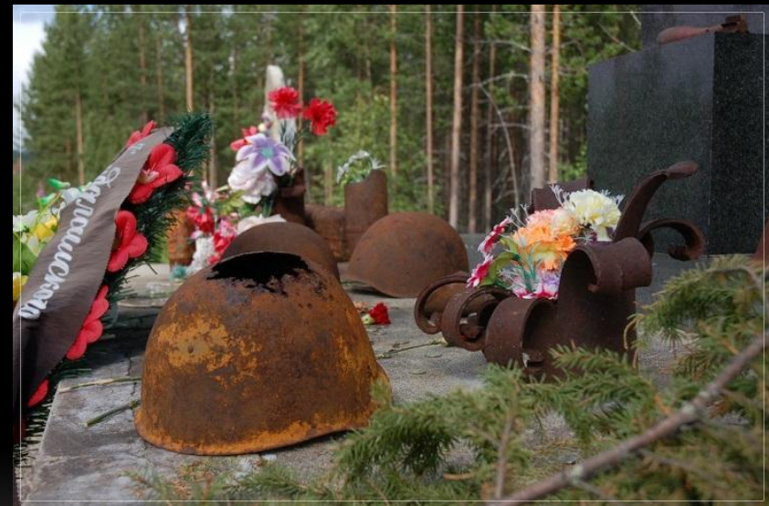
МЕМОРИАЛ СОВЕТСКИМ ВОИНАМ-ПОБЕДИТЕЛЯМ НА РУБЕЖЕ ВЕРМАН