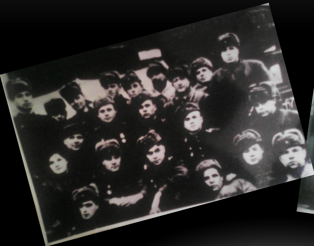
ФОТО ВОЕННОГО ВРЕМЕНИ