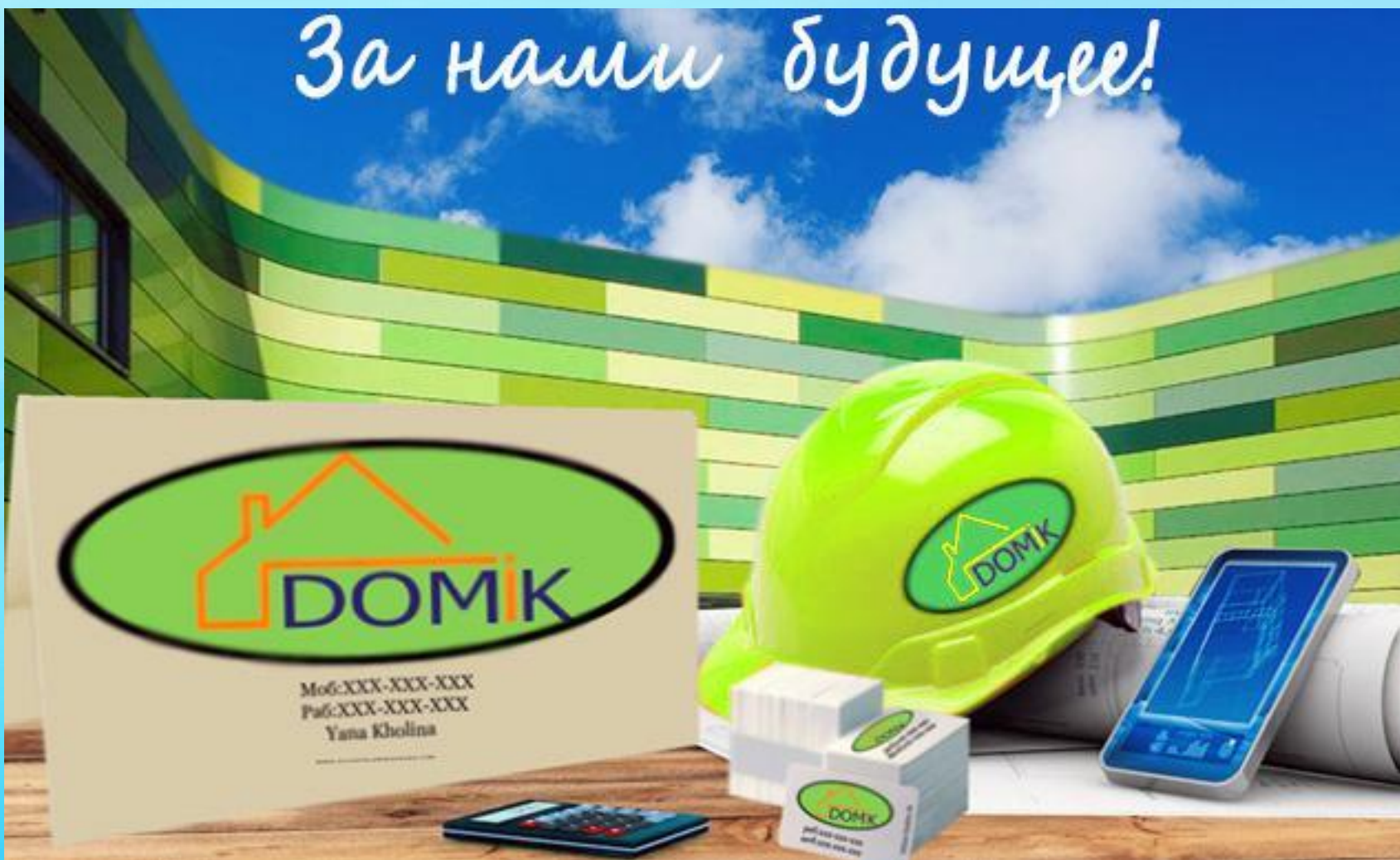
Фирменный плакат компании «Дом и К»