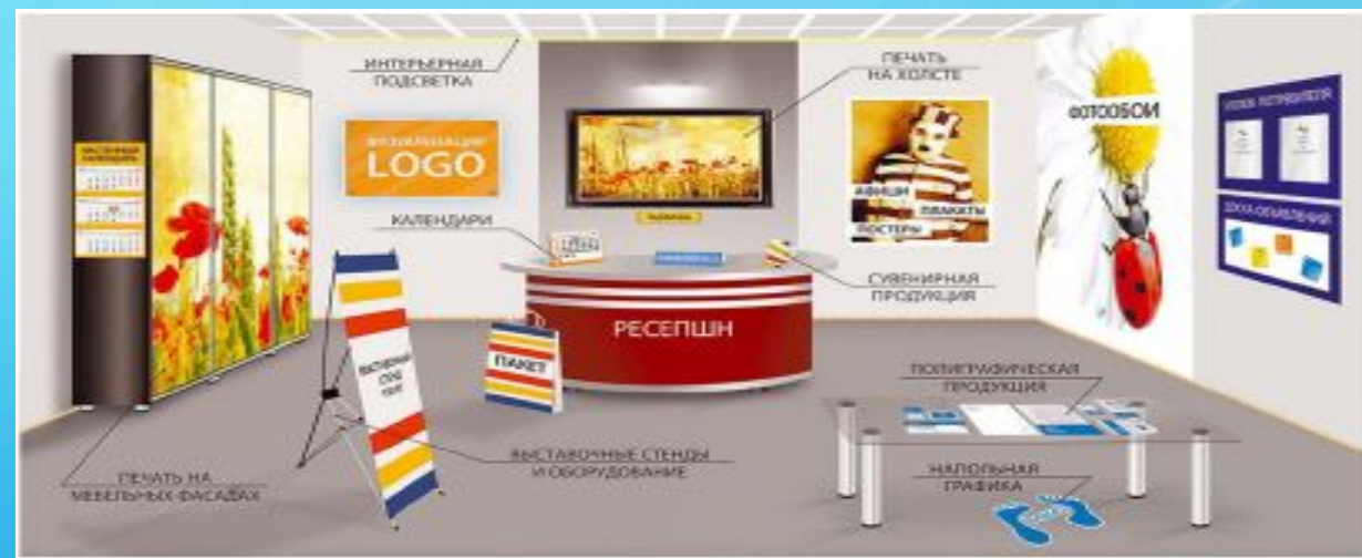
Примеры корпоративных героев, фирменной одежды, деловой документации, рекламно-информационной продукции