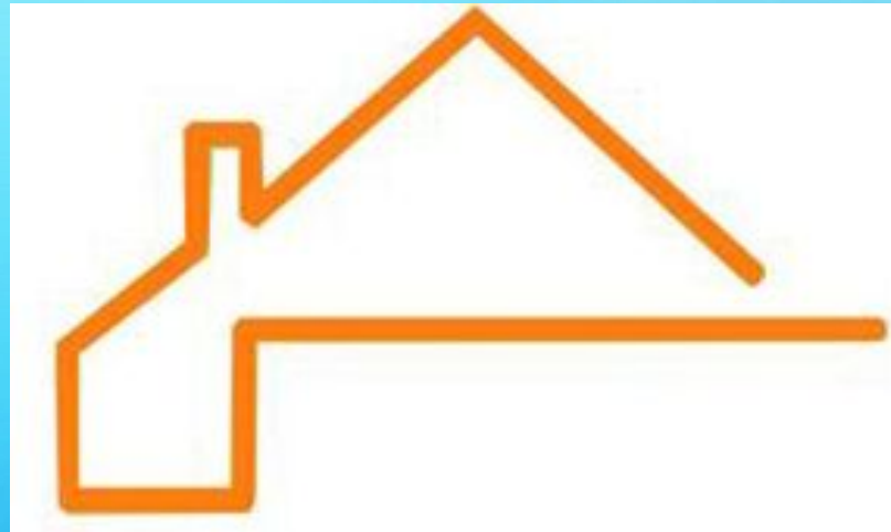
Изображение двускатной крыши дома (основа логотипа)

В основу дизайн-концепции фирменного стиля строительной компании «Дом и К» легло стилизованное изображение двускатной крыши дома и трубы, которые стали основой логотипа, что послужило своеобразной крышей, под которой расположено название компании.