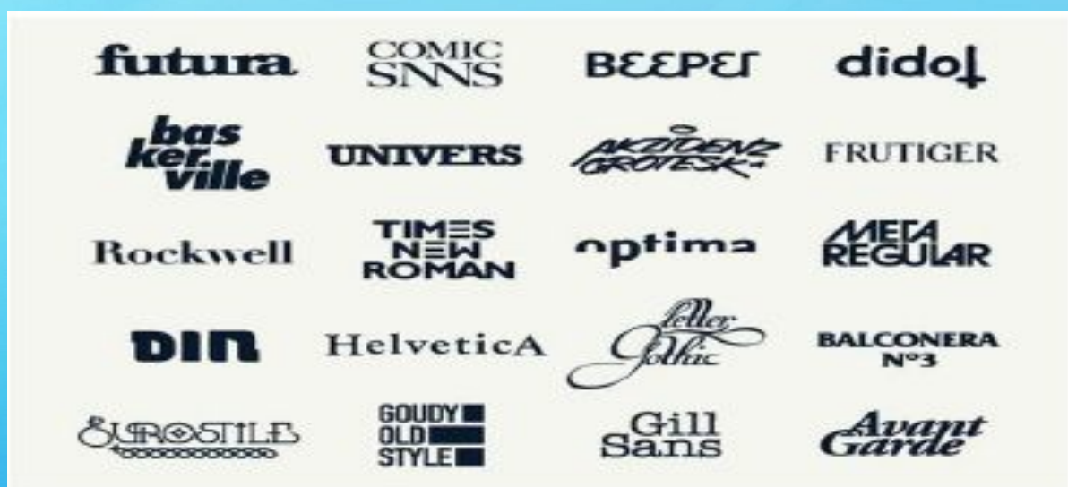
Пример фирменного блока, фирменного лозунга, фирменного цвета, фирменных шрифтов