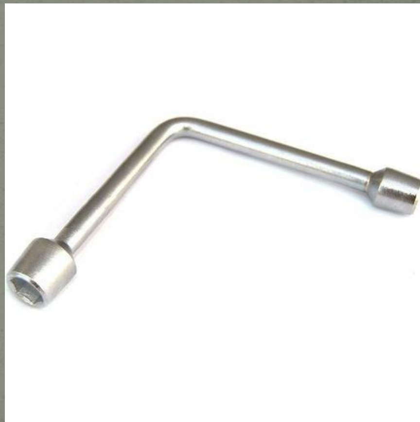
Рожковый и торцевой ключи