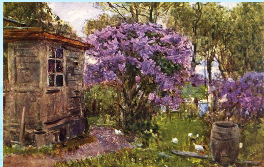
Сирень в цвету