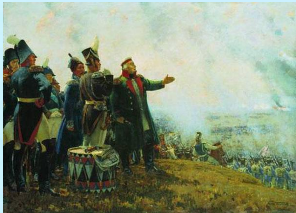
Кутузов на Бородинском поле