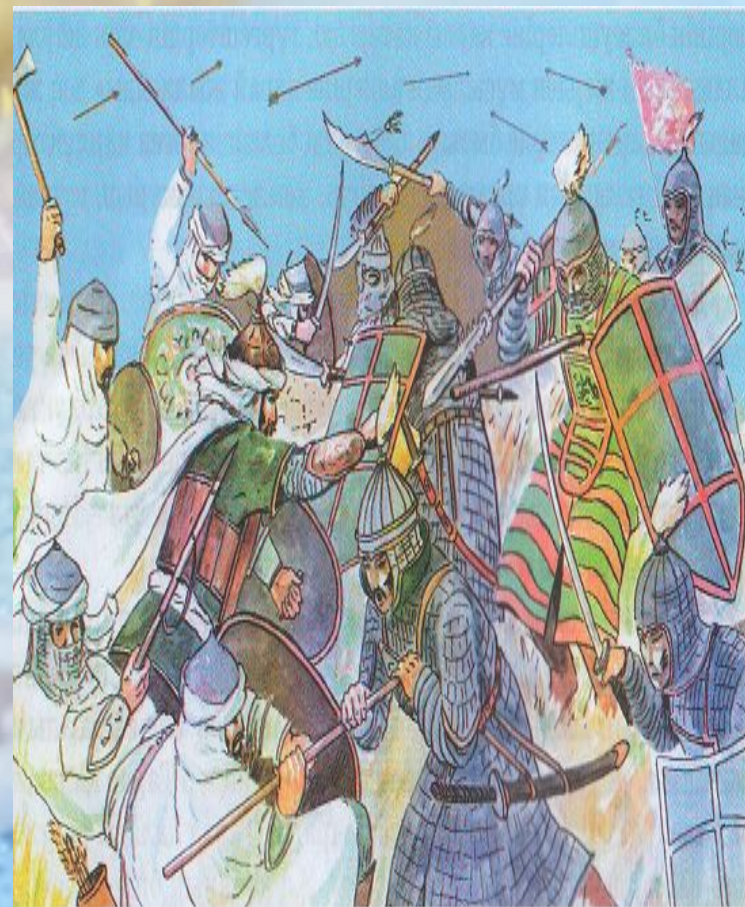
751 жылғы Атлах шайқасы. Т. Асықов салған сурет.

Сұлу қаған қайтыс болғаннан кейін сары және қара түркештер арасында 20 жылға созылған талас-тартыс басталады. Қағандықтың саяси және экономикалық жағдайын мүлде әлсіретіп жібереді. Қағандықтың мұндай жағдайын біліп отырған Қытай империясы Куш қаласындағы (Шығыс Түркістан) әскерін Жетісуға аттандырып, 748 жылы Суябты жаулап алады. Бұдан кейін Қытай әскерлері Ташкентті басып алып, оның әмірін өлтіреді. Әмірдің ұлы арабтарды көмекке шақырады. 751 жылы Тараз маңындағы Атлах қаласының түбінде арабтармен қарлұқтар бірігіп қытай әскерін жеңеді. Бұл жеңіс Орта Азия жеріндегі Қытай империясының билігін біржолата жояды.