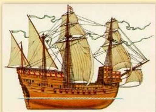
корабль - б5