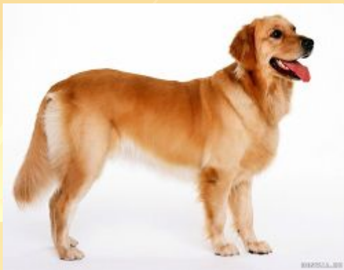
собака - б3