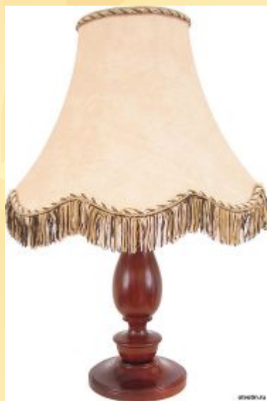
лампа - п4