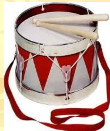
барабан - б1б5