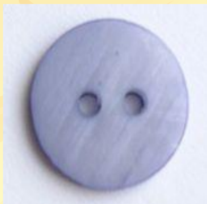
пуговица - п1