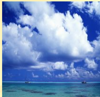
облака - б2