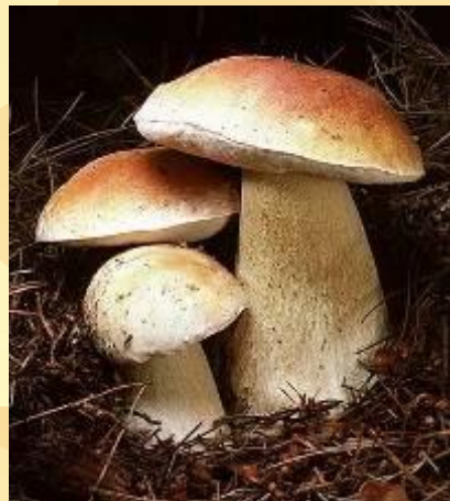
грибы - б4 сапоги - п3