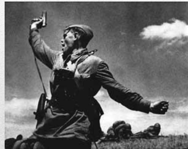
Фотография, ставшая одним из символов Великой Отечественной войны

22 июня 1941 года— началась Великая Отечественная война, музыкальным символом которой стала песня композитора Александра Александрова на стихи поэта Василия Лебедева- Кумача «Священная война» («Вставай, страна огромная»).