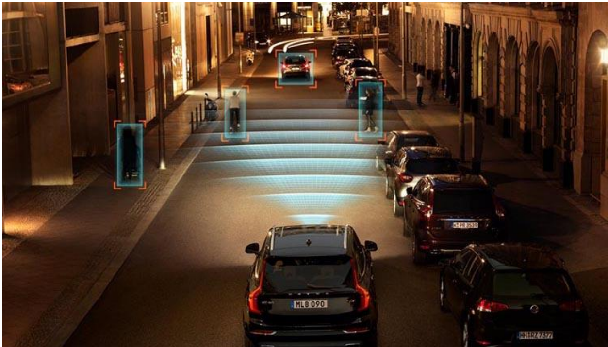
Рисунок 9 – Система виявлення пішохода

Система розпізнає людей біля автомобіля, автоматично уповільнює автомобіль, знижує силу удару і навіть уникає зіткнення. Застосування системи дозволяє на 20% скоротити смертність пішоходів при дорожньо-транспортній пригоді і на 30% знизити ризик важких травм. В системі виявлення пішоходів реалізовані наступні взаємопов'язані функції: виявлення пішоходів, попередження про небезпеку зіткнення та автоматичне гальмування.