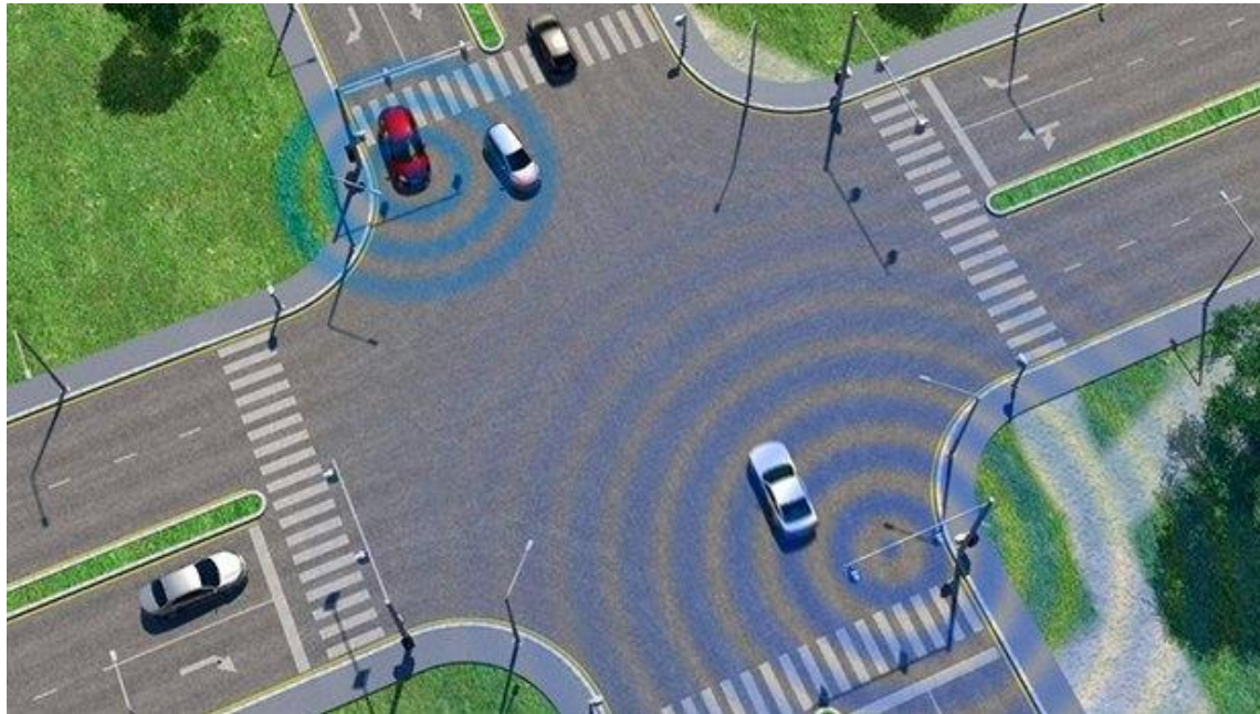
Рисунок 6 – Ілюстрація системи “vehicle-to-vehicle”

Система комунікації автомобіль-автомобіль V2V (vehicle-to-vehicle) дозволяє водієві «заглянути за кут» і завчасно отримати інформацію про небезпеки, які знаходяться за межами прямої видимості. Компанія «Cadillac» першою в США почала оснащувати автомобілі системою комунікації один з одним. За допомогою технології виділеного зв'язку на коротких відстанях DSRC (Dedicated Short-Range Communications) і GPS транспортні засоби зможуть обмінюватися між собою інформацією про дорожньо-транспортні пригоди, критичні ситуації на дорозі, небезпечні маневри інших автомобілів. Блок керування моніторить напрямок і швидкість руху машини, її геолокацію і показники датчиків систем активної безпеки