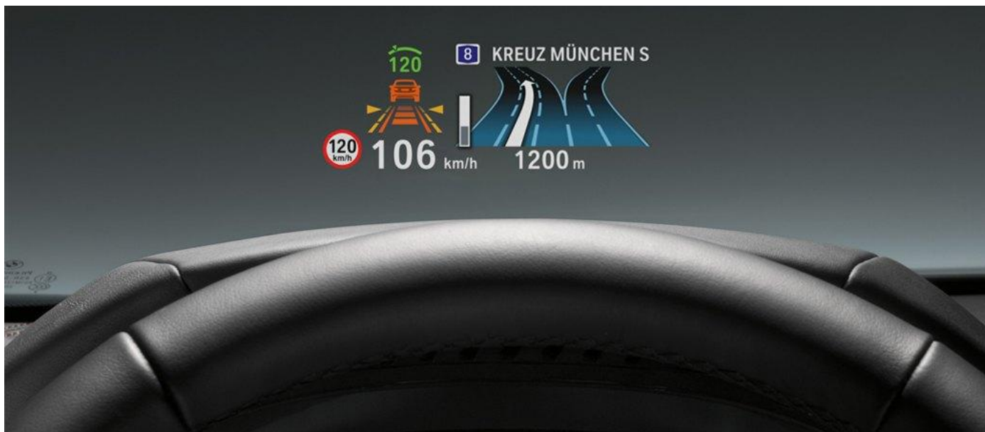
Рисунок 2 – Модифікований ІЛС

Індикатор на лобовому склі (ІЛС) – пристрій відображення інформації, призначений для відображення символічної та графічної інформації на лобовому склі. Застосовується в автомобілях і літальних апаратах (навігаційно-пілотажна і спеціальна інформація). Використання ІЛС дозволяє в значній мірі знизити ймовірність інформаційного перевантаження водія, вимушеного стежити одночасно за навколишнім простором, так і за показаннями численних приладів. На сьогоднішній день близько 2% автомобілів вже оснащені подібною технологією. Зараз відбуваються розробки, коли на скло буде проектуватися «доповнена реальність» з докладною навігаційною інформацією, номерами будинків, назвами вулиць та стрілками, що підказують, куди потрібно повернути і якої смуги варто дотримуватися.