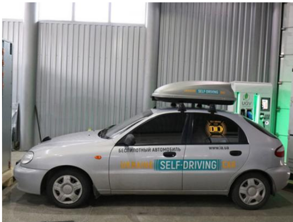
Рисунок 13 – Безпілотний Lanos

В Україні в березні 2018 року запорізька компанія «Інфоком ЛТД» розробила безпілотний автомобіль Lanos. Дана модель є першим легковим «безпілотником», представлений українцями: Lanos обладнаний системою навігації Pilotdrive. Сенсорні системи розпізнають дорожні знаки, пішоходів і навіть тварин, що вибігають на проїжджу частину. Система орієнтується за допомогою камер, датчиків, радарів і тепловізора, що робить автомобіль безпілотним навіть в нічний час доби. Автопілот розпізнає розмітку дороги, її ширину, вміє пересуватися в умовах бездоріжжя.