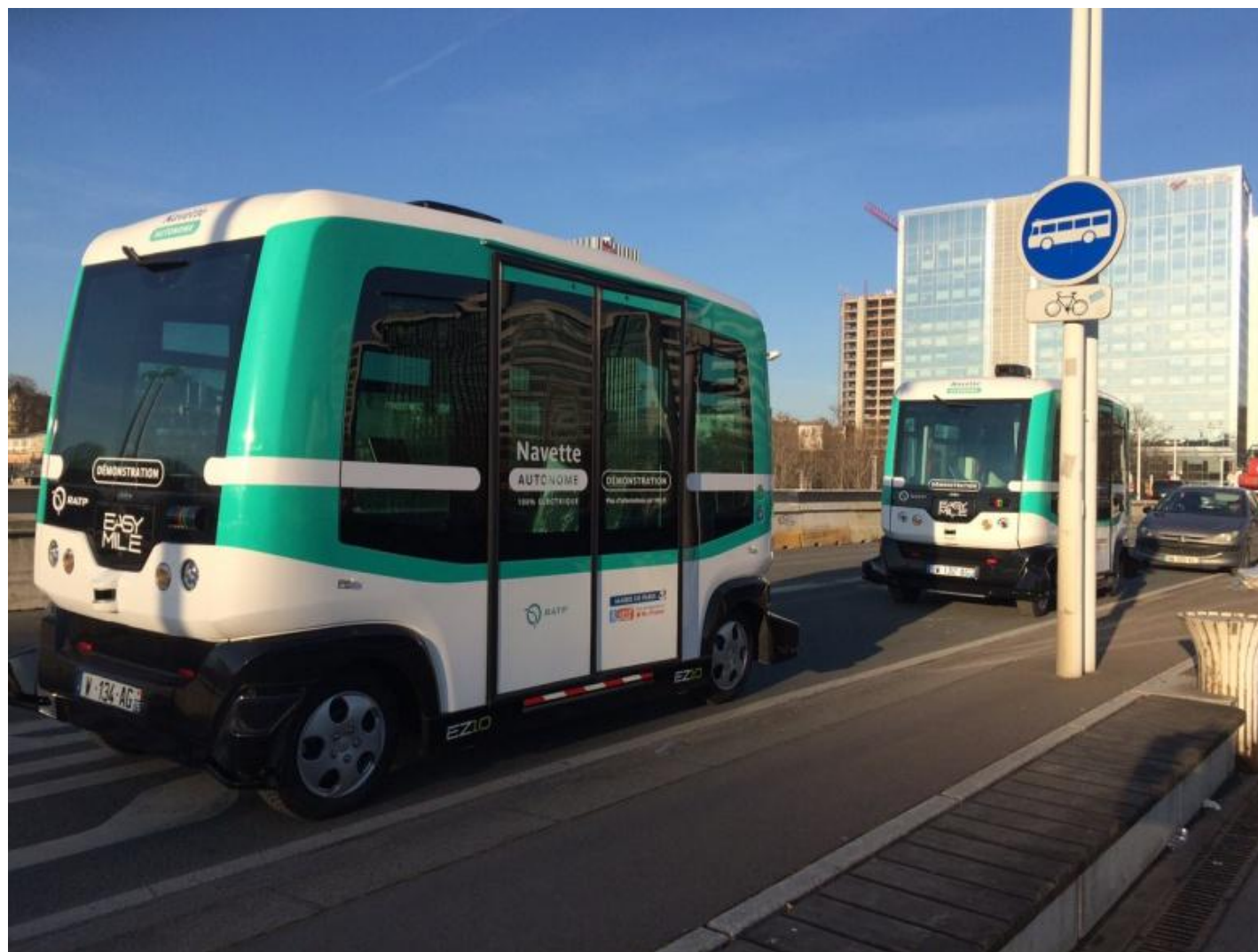
Рисунок 12 – Безпілотний міні-автобус EZ10