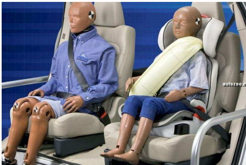
Рисунок 4 – Ремені безпеки

Ремені безпеки з вбудованою подушкою безпеки в автомобілі були вперше представлені компанією «Ford». У разі аварії подушки розкриються протягом 40 мс після удару, збільшуючи розмір ременя і утримуючи людини в більш безпечному положенні. Вони дозволяють рівномірно розподілити навантаження на грудну клітину пасажирів. Це істотно знижує ймовірність отримання серйозних травм при спрацьовуванні обмежувача в ременях, зокрема – переломів ребер.