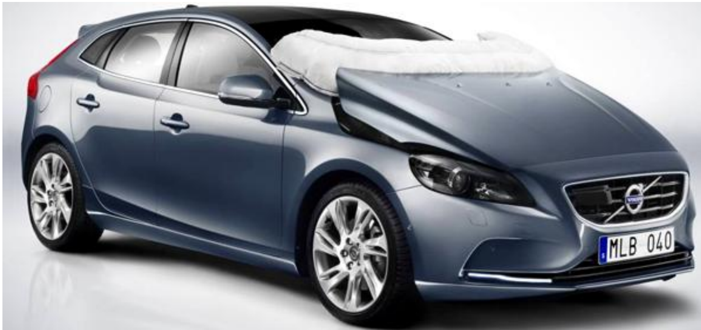
Рисунок 10 – Подушка безпеки для пішоходів

Подушка безпеки для пішоходів (Pedestrian Airbag System), яка представлена компанією «Volvo» з 2012 року. Система призначена для зниження ступеня пошкодження пішохода при зіткненні з автомобілем. Подушка безпеки надувається зовні автомобіля і закриває нижню частину лобового скла і бічні стійки. Вона складається з наступних конструктивних елементів: датчиків зіткнення, блоку управління (модуль пішохода), механізмів звільнення шарніра капота і власне подушки безпеки.