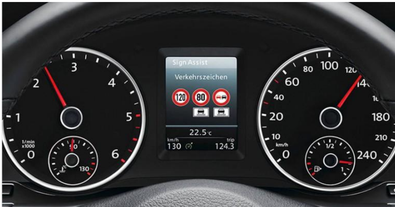
Рисунок 8 - Система розпізнавання дорожніх знаків TSR

Система розпізнавання дорожніх знаків TSR покликана попереджати водіїв про необхідність дотримання швидкісного режиму. Дана система розпізнає дорожні знаки обмеження швидкості при їх проїзді і нагадує водієві поточну максимальну дозволену швидкість, якщо він рухається швидше. Вона конструктивно складається з відеокамери, блоку управління і пристрою подачі інформації. Система розпізнавання дорожніх знаків другого покоління інформує водія про різні дорожні знаки: рух без зупинки заборонено, заборона обгону, тощо.