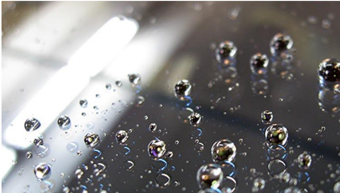
Рисунок 5 – Ілюстроване уявлення про гідрофобні вікна

В основі створення захисних нанопокриттів нового покоління лежить так званий «метод хімічного щеплення»: захисне нанопокриття наноситься на поверхню матеріалу, який необхідно захистити від впливу агресивних агентів навколишнього середовища і закріплюється на ньому за рахунок міцних хімічних зв'язків. Після обробки засобом скло набуває гідрофобних властивостей. У результаті скло не змочується, набуває теплоізоляційних якостей, стає стійким до обмерзання, зовнішніх забруднень (дим, пил, бруд, органічні забруднення): під час дощу, мокрому снігу зберігається хороша видимість, краплі легко скочуються зі скла під тиском повітряного потоку. При швидкості від 50 км/год двірники не потрібні.