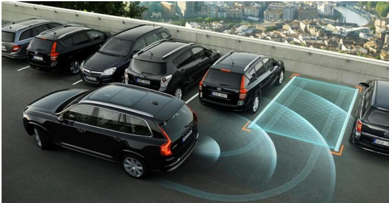
Рисунок 11 – Ілюстрація процесу автоматичного паркування

Існує система автоматичного паркування, яка відноситься до активних паркувальних систем, так як забезпечує паркування автомобіля в автоматичному чи автоматизованому режимах. Автоматичне паркування здійснюється за рахунок узгодженого управління кутом повороту рульового колеса і швидкості руху автомобіля. Конструкція системи автоматичного паркування включає ультразвукові датчики, вимикач, електронний блок управління, а також виконавчі пристрої систем автомобіля. Включення системи здійснюється примусово за необхідності здійснити паркування.