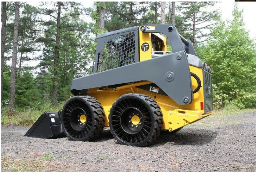
Рисунок 3 – Безповітряні шини