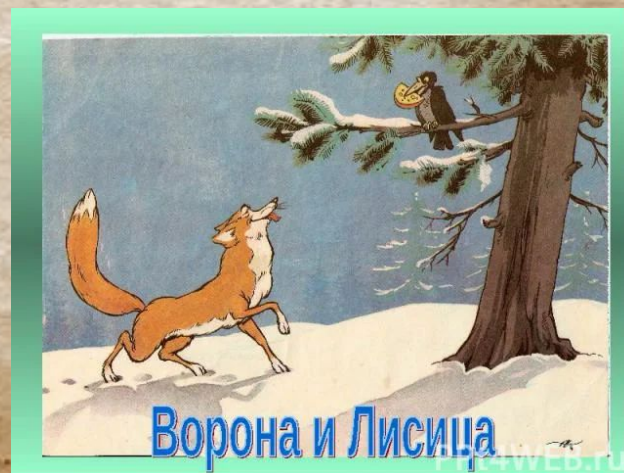
Ворона и Лисица