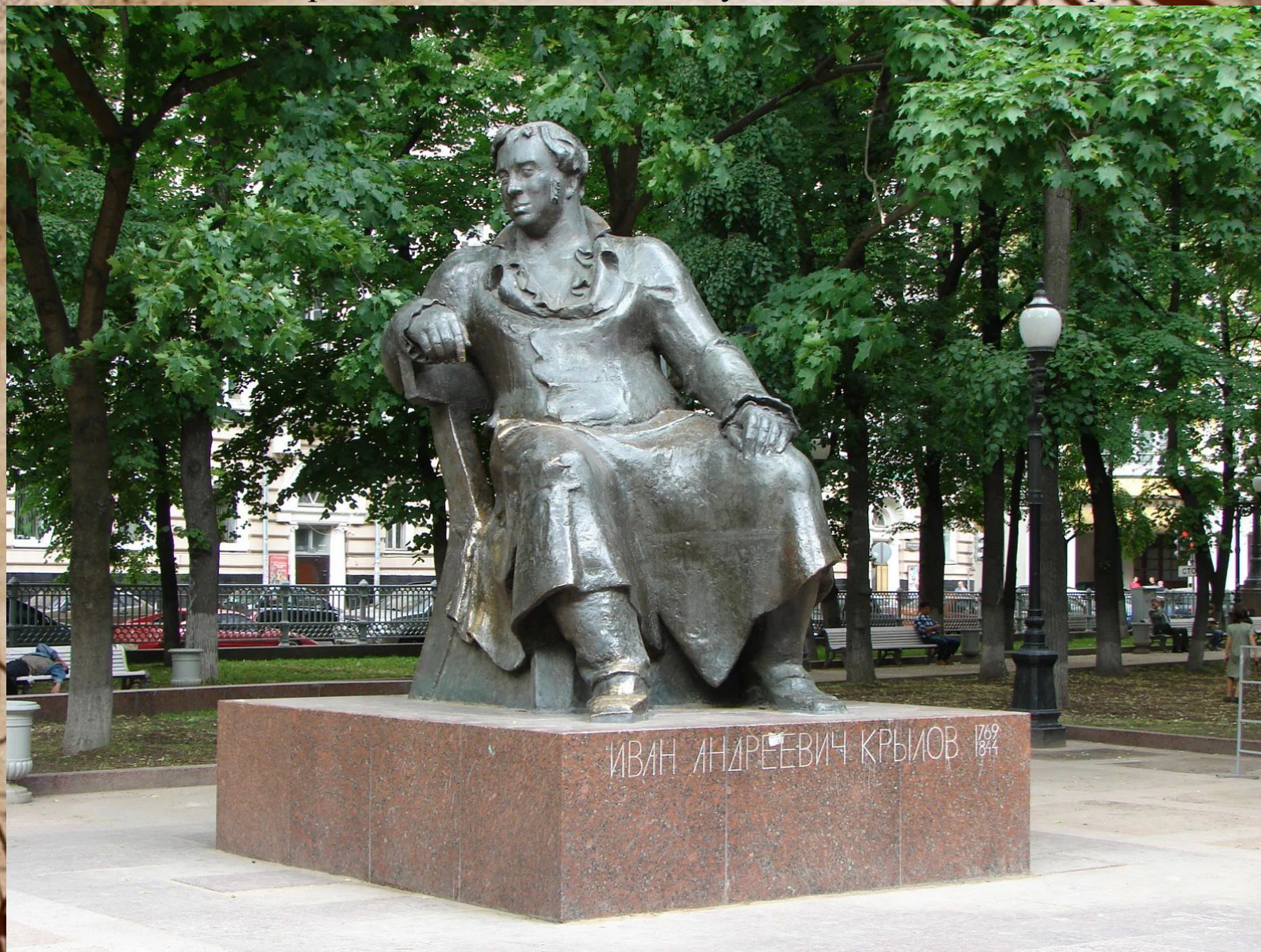
Памятник И. А. Крылову у Патриарших прудов в Москве

Последнюю басню Крылов написал в 1836 году. Его не стало 21 ноября 1844 года.