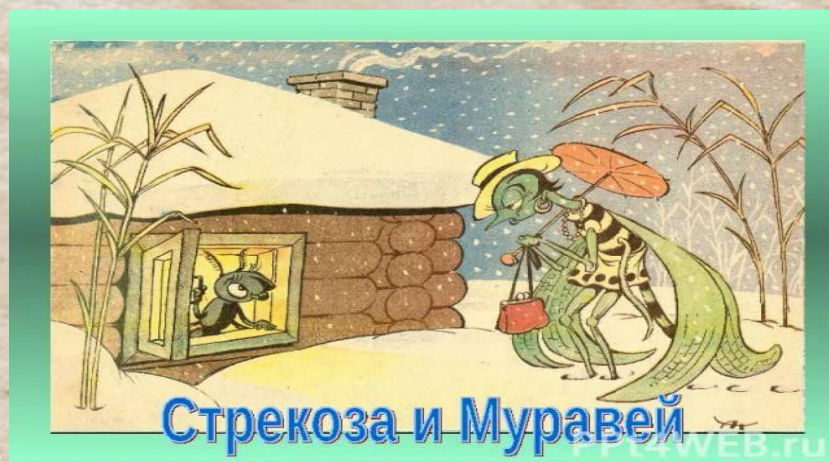
Стрекоза и Муравей