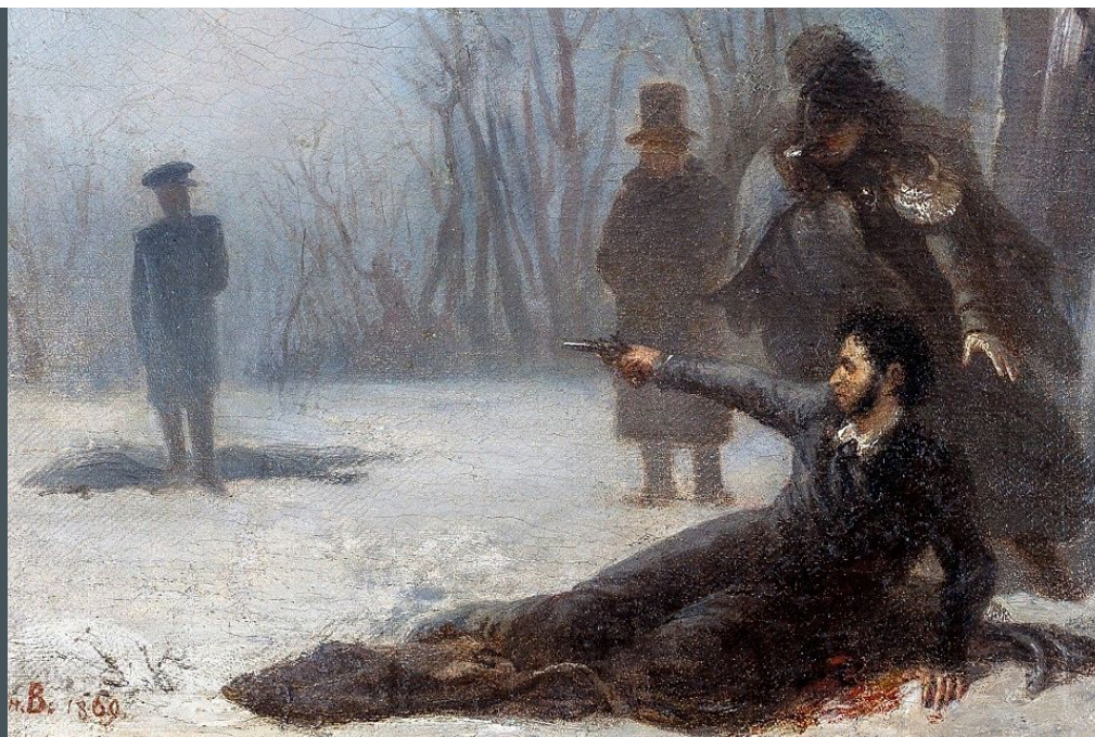
«Дуэль А.С. Пушкина с Дантесом», художник Адриан Волков