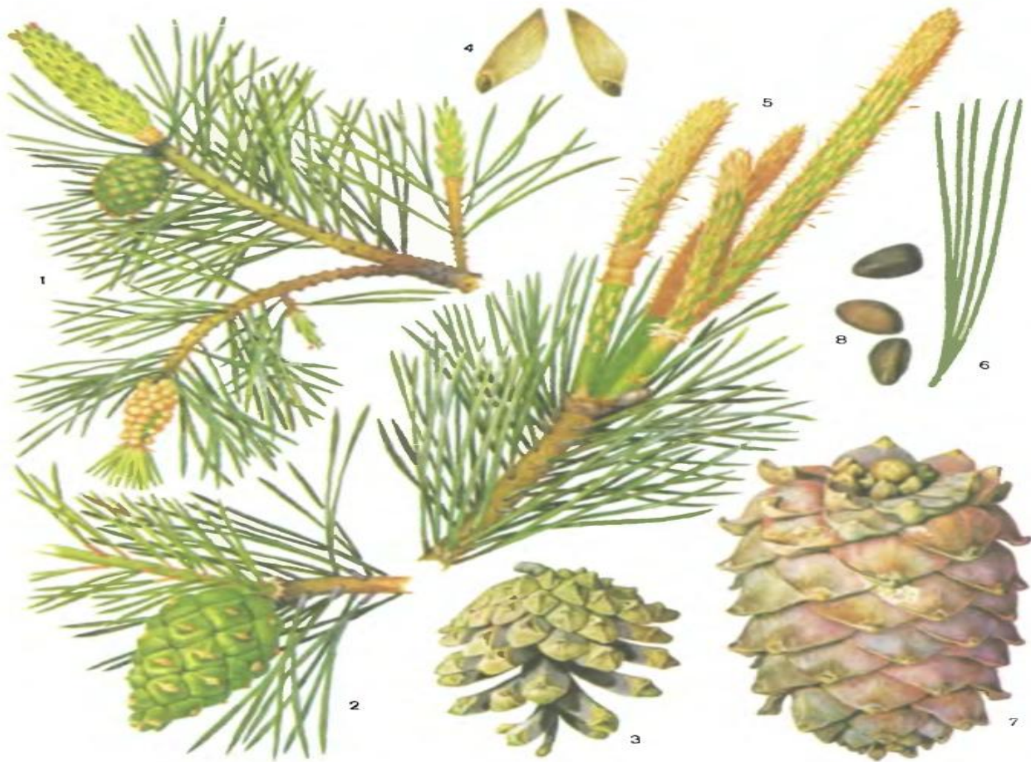
Таблица 52. Сосновые.

Сосна обыкновенная ( Pinus sylvestris ): 1 — ветвь с шишкой и собранием микростробил; 2 — молодая шишка; 3 — зрелая шишка; 4 — семена; 5 — ветвь с молодыми побегами. Сосна сибирская ( P. sibirica ): 6 — укороченный побег с пятью листьями; 7 — зрелая шишка; 8 — семена.