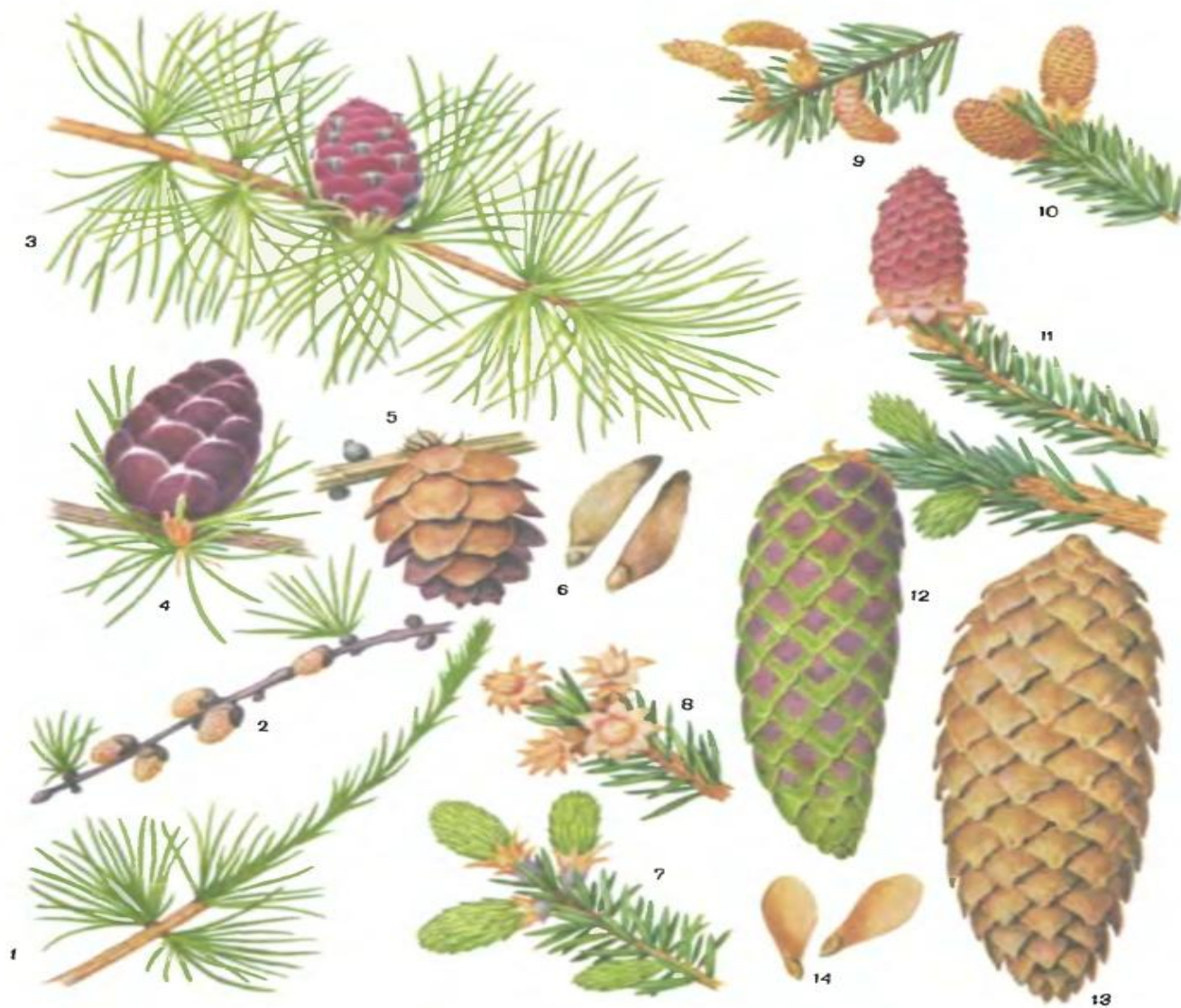
Таблица 51. Сосновые.

Лиственница сибирская ( Larix sibirica ): 1 — укороченные и удлиненный побеги; 2 — веточка с микростробилами; 3—5 — различные стадии созревания шишки; 6 — семена. Ель обыкновенная ( Picea abies ): 7 — вегетативные почки; 8 — почечные чешуи у микростробилов; 9—11 — веточки с микростробилами; 12—13 — различные стадии созревания шишки; 14 — семена.