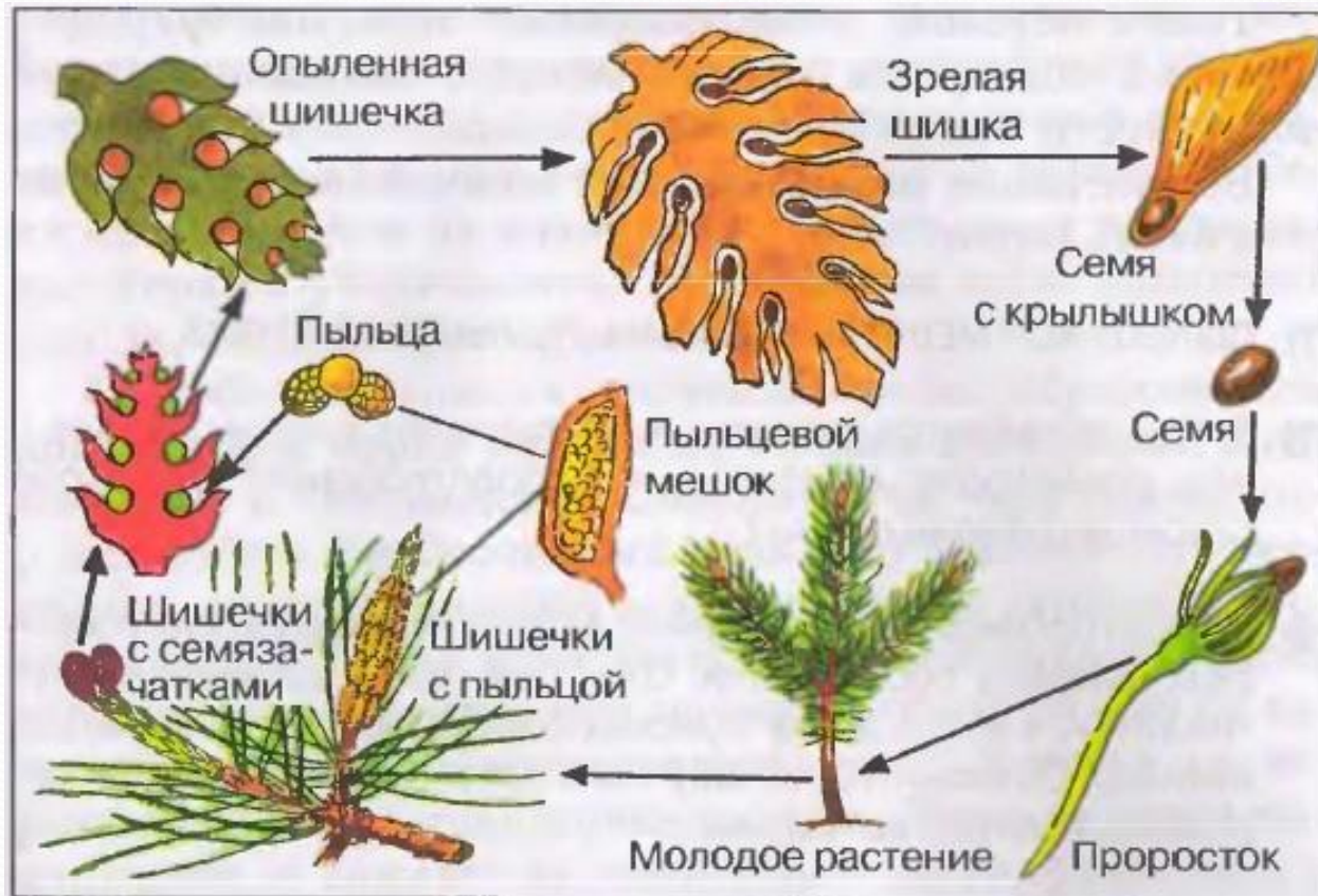
146. Развитие голосеменных