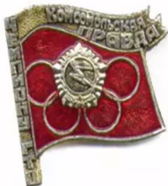
ЗНАЧОК «ЧЕМПИОНУ ГТО», АЛМА-АТА, 1979 ГОД