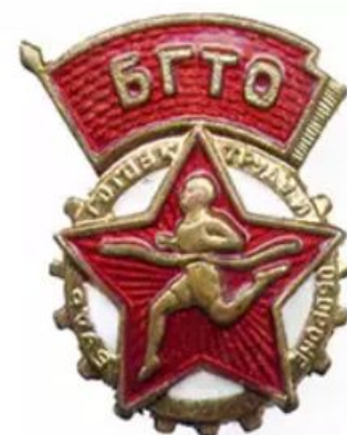
ЗНАЧКИ ГТО II СТУПЕНИ 1946– 1961 ГОДОВ