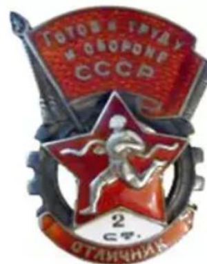
ЗНАЧОК «ОТЛИЧНИК ГТО» 2 СТУПЕНИ 1940-1946 ГОДОВ (СЕРЕБРО)