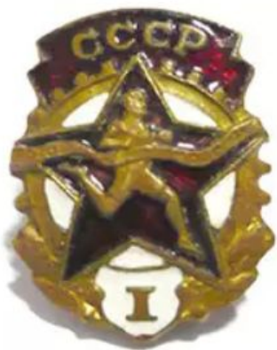
ЗНАЧОК «БУДЬ ГОТОВ К ТРУДУ И ОБОРОНЕ»