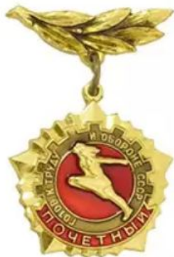
ПОЧЕТНЫЙ ЗНАК ГТО