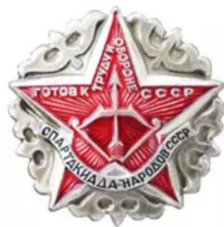
ЗНАЧОК РЕГИОНАЛЬНЫХ СОРЕВНОВАНИЙ ГТО – СПАРТАКИАДА НАРОДОВ СССР»