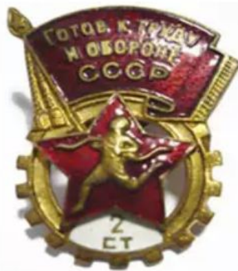
ЗНАЧОК «БУДЬ ГОТОВ К ТРУДУ И ОБОРОНЕ»