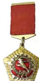
ЗНАК «50 ЛЕТ КОМПЛЕКСУ ГТО»