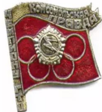
ЗНАЧОК «ЧЕМПИОНУ ГТО», ТБИЛИСИ, 1977 ГОД