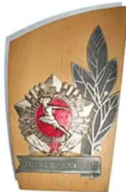
ЗНАК «ЗА УСПЕХИ В РАБОТЕ ПО КОМПЛЕКСУ ГТО»