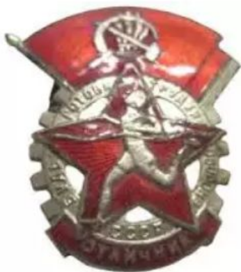
ЗНАЧОК ГТО 1 СТУПЕНИ