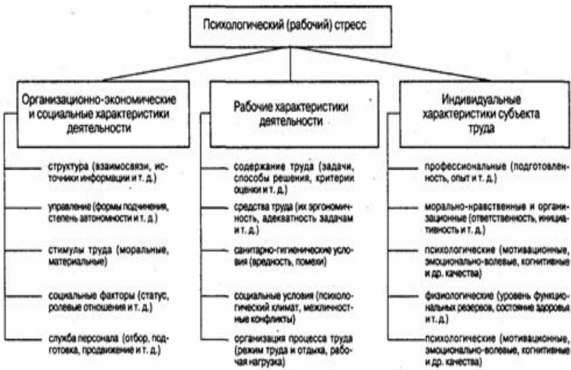
Рис. 25-2. Схема основных источников (причин) развития психологического (рабочего) стресса