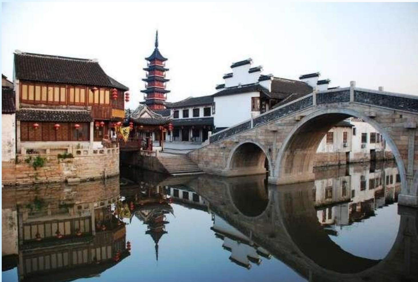
Город на воде Чжуцзяцзяо

С чем угодно можно ассоциировать Шанхай: небоскребами, производством и промышленностью, но с городом, окруженным каналами, — крайне сложно. В 50 км от центра города, находится необычное для Китая место, называемое шанхайской Венецией.