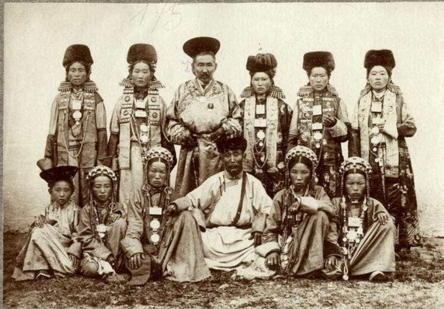
175. Типы селенгинских бурят /Забайкальск. обл./

Большая патриархальная семья составляла основную социальную и хозяйственную ячейку бурятского общества. Общество бурят в то время было родовым. Каждый род вел свою родословную от одного предка – родоначальника (удха узуур), люди рода были связаны тесными кровными узами. Большая семья жила обычно следующим образом – каждый улус состоял из нескольких аилов. В аиле было одна, две, три и более юрт с разными пристройками. В одном из них, она обычно стояла в центре, жил старейшина семьи, старик со старухой, иногда с какими-нибудь сиротами – родственниками. У некоторых бурят, как и у монголов, с родителями жила семья младшего сына – одхона, который должен был заботиться о родителях. В других юртах жили старшие сыновья с семьями. У всего аила были общие пашни, покосы – утуги, скот. Далее в улусе жили их родственники – дядья (нагаса), двоюродные братья.