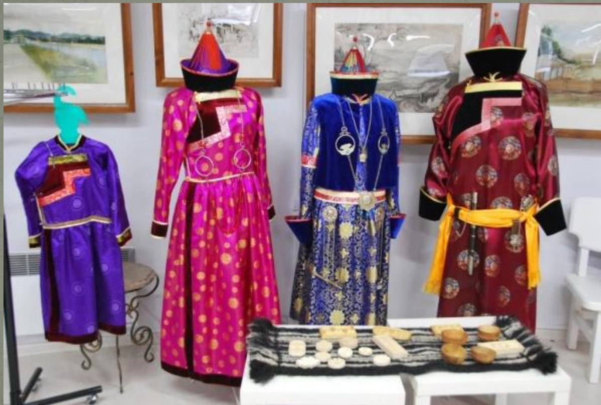
Традиционные костюмы бурят

Основу духовной культуры бурят составляет комплекс духовных ценностей, относящихся в целом к культуре монгольского этноса. В условиях, когда в течение долгих веков население Прибайкалья испытывало на себе влияние многих народов Центральной Азии, а позже и с пребыванием в составе России, в силу того, что Бурятия оказалась на стыке двух систем культуры — западно-христианской и восточно-буддийской — культура бурят как бы трансформировалась, оставаясь по виду прежней.