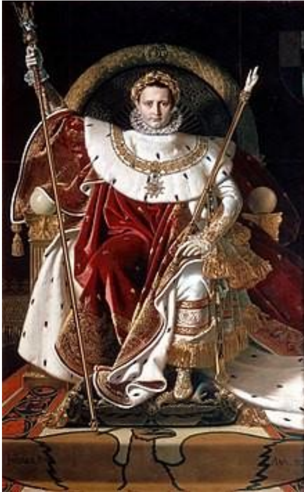
Наполеон на императорском троне, картина Жана Энгра.