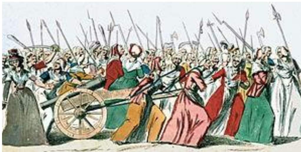
Иллюстрация Похода на Версаль, 5 октября 1789 года.