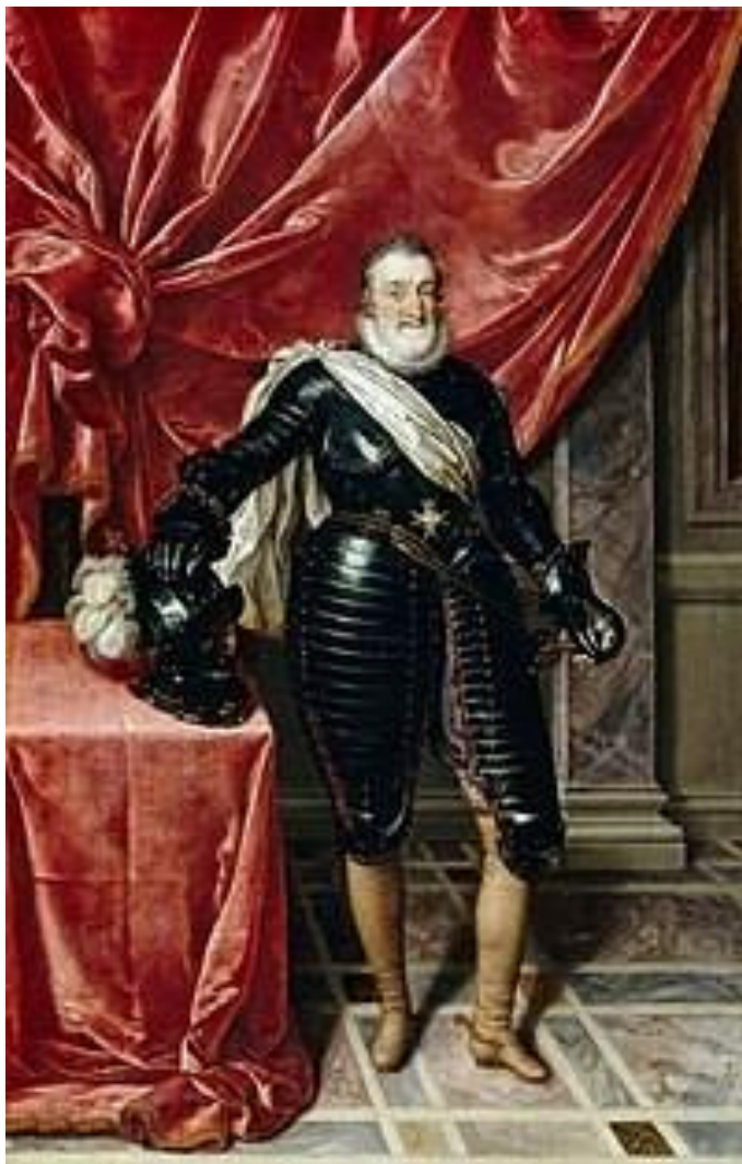
Генрих IV первый Французский король из дома Бурбонов.