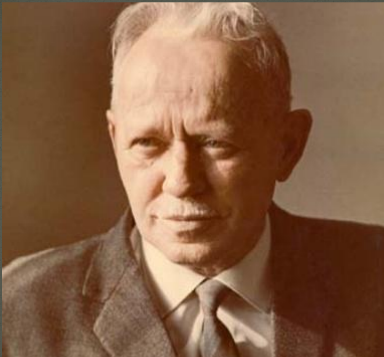
М. А. ШОЛОХОВ