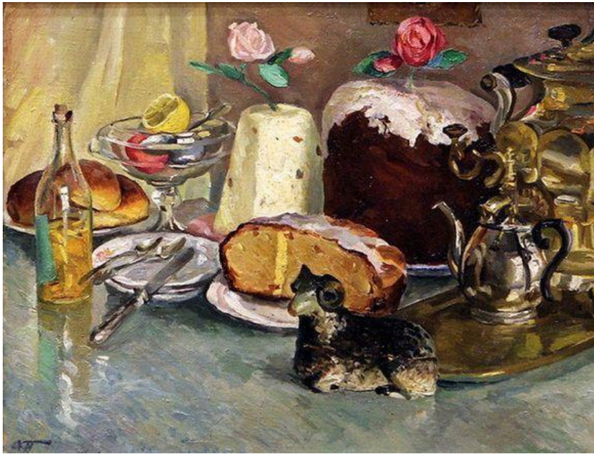
Аркадий Пластов. Пасхальный натюрморт