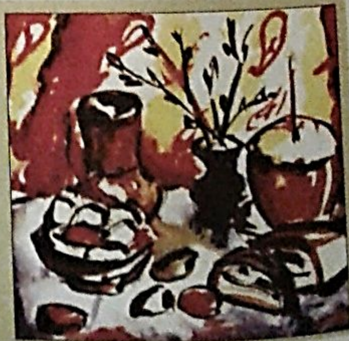
Пасхальный натюрморт. Варианты композиции