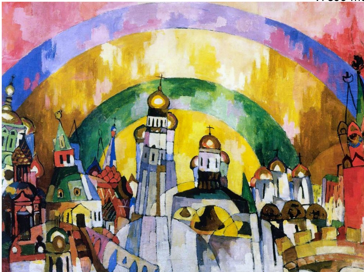
Аристарх Васильевич Лентулов. Небозвон 1920-е гг