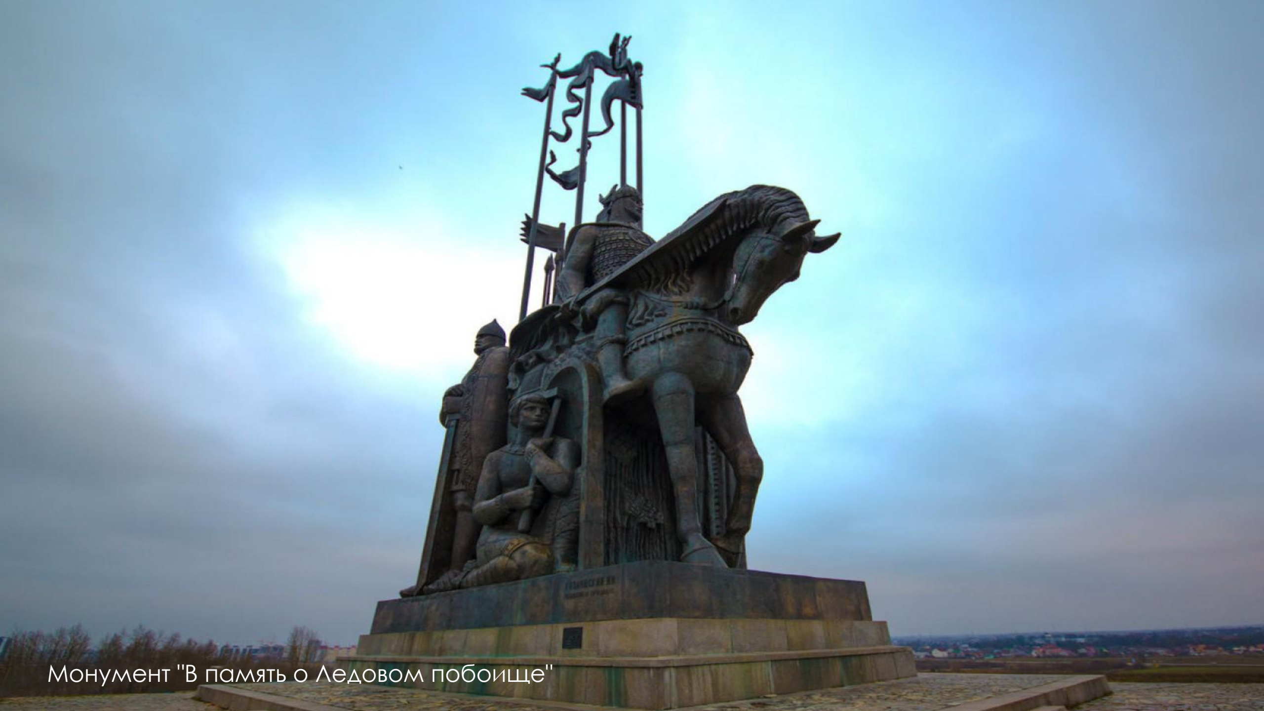
Монумент "В память о Ледовом побоище"