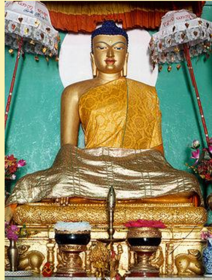
Статуя Сиддхартхи Гаутамы в Бодх-Гае, Индия. Бодх-Гая традиционно считают местом его просветления!